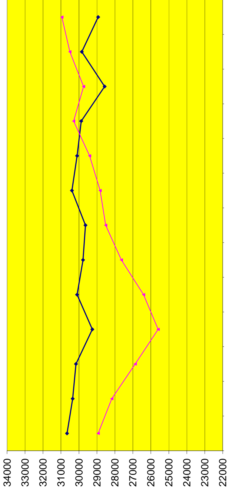
Periode 2007-2008 Siste 12 måneder