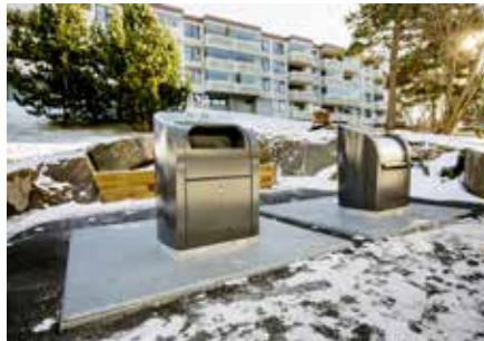
◀ ALT PÅ STELL: Det har også blitt laget til et nedgravd avfallssystem i Lohøgda borettslag.