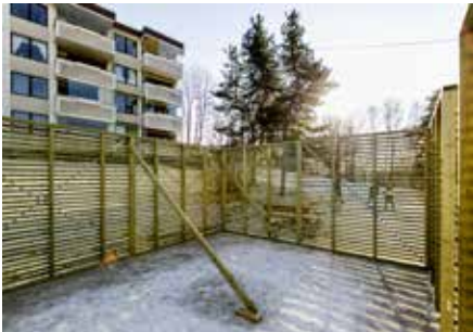
▲ TRANSFORMASJON: Tørkebåser ble til sykkelparkering.