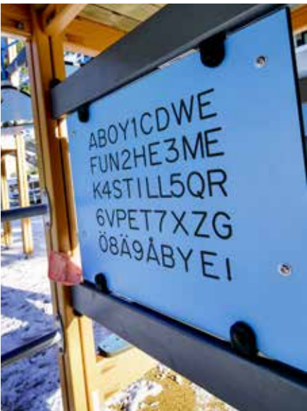
▲ VIKTIG: Nye lekeplasser var høyt prioritert i planene til Lohøgda borettslag