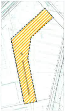
Verdikategori 1 - under grunnen - under G2 - Pave