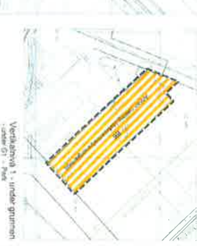
Verdikategori 1 - under grunnen - under G1 - Pave