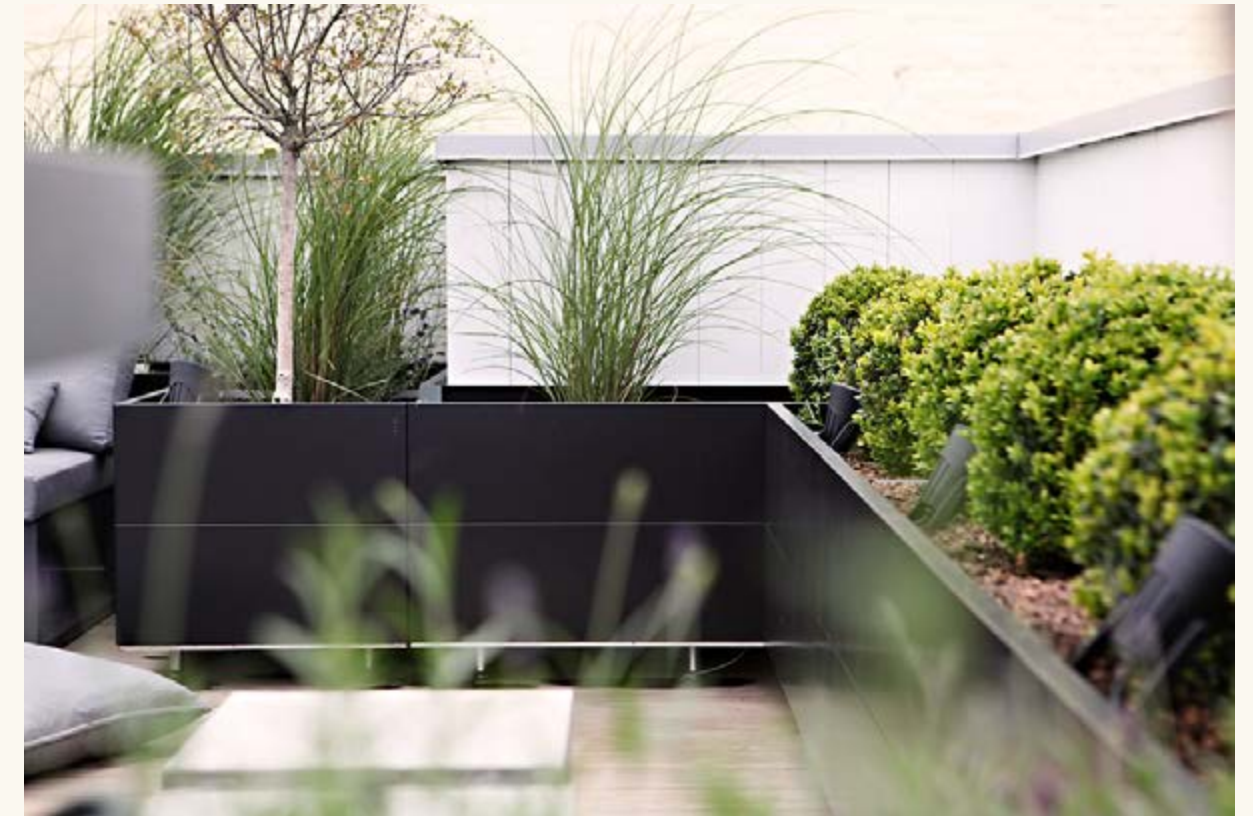
Alle leiligheter får tilbud om plantekasser på hjul til spesialpriser fra fra bedd.no