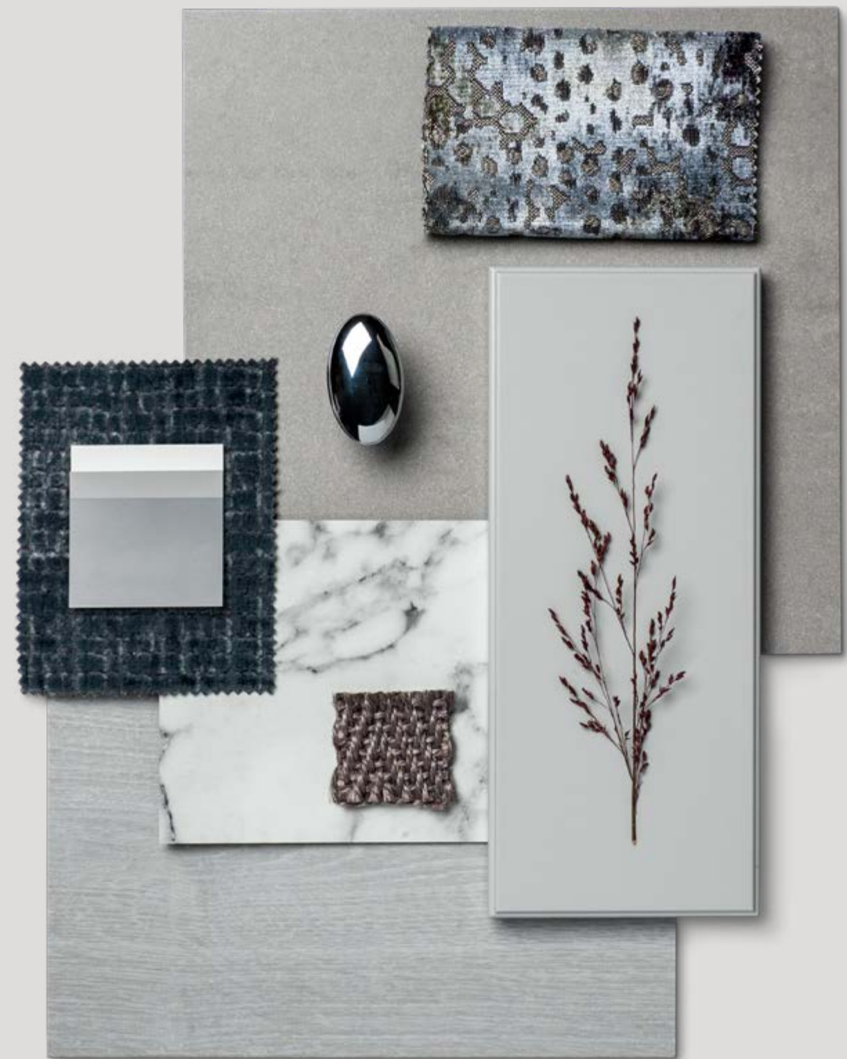
Moodboard til inspirasjon for interiørvalget. Tekstiler og tapet leveres ikke på tilvalg.