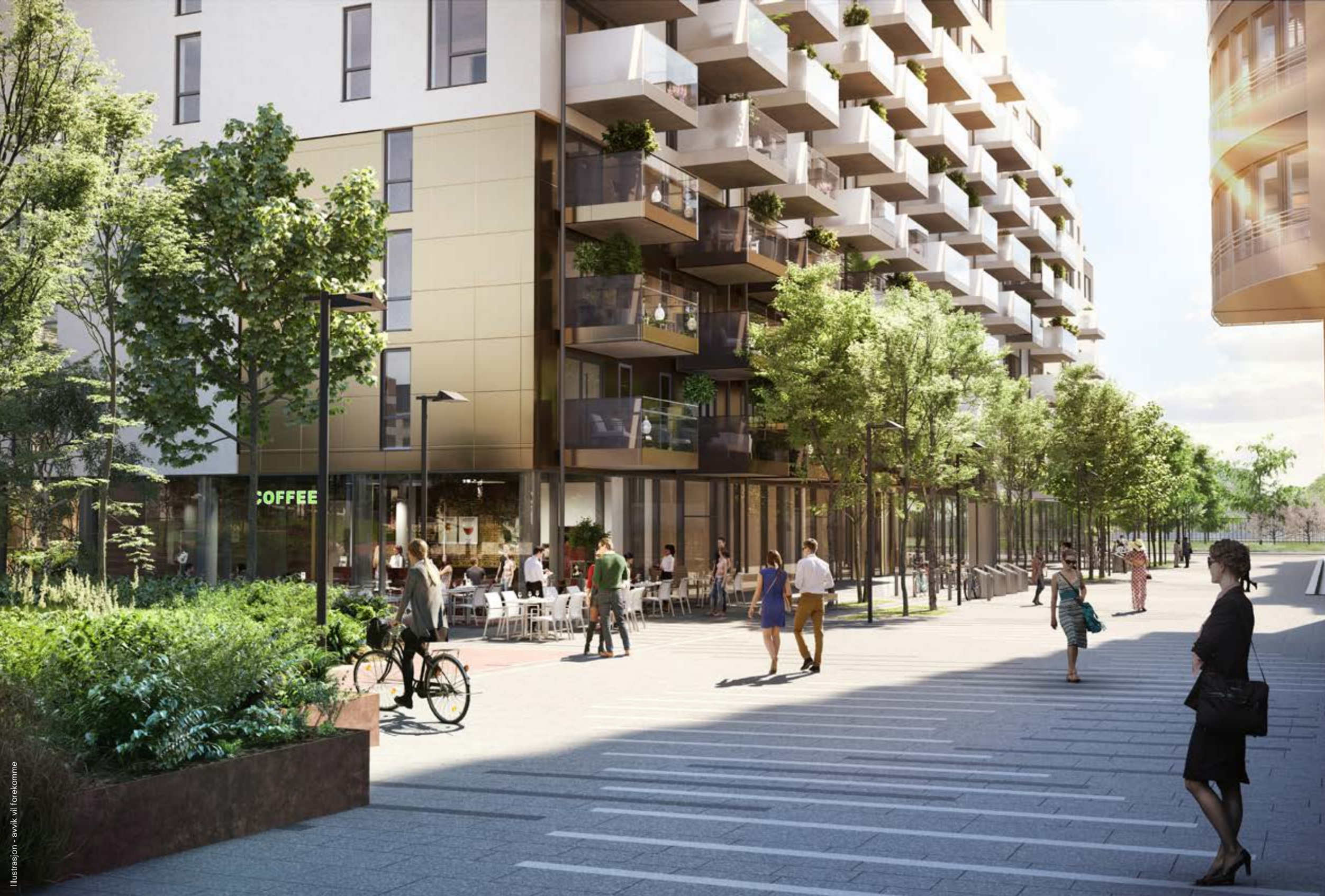
Fabrikkgata mot Frognearparken

“Hovedmaterialet er lyse pussede flater, med innslag av metall og glass.”