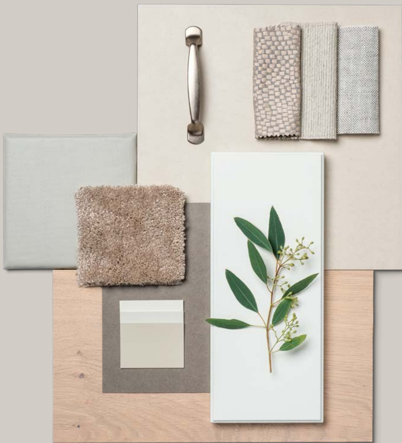
Moodboard til inspirasjon for interiørvalget. Tekstiler og tapet leveres ikke på tilvalg.