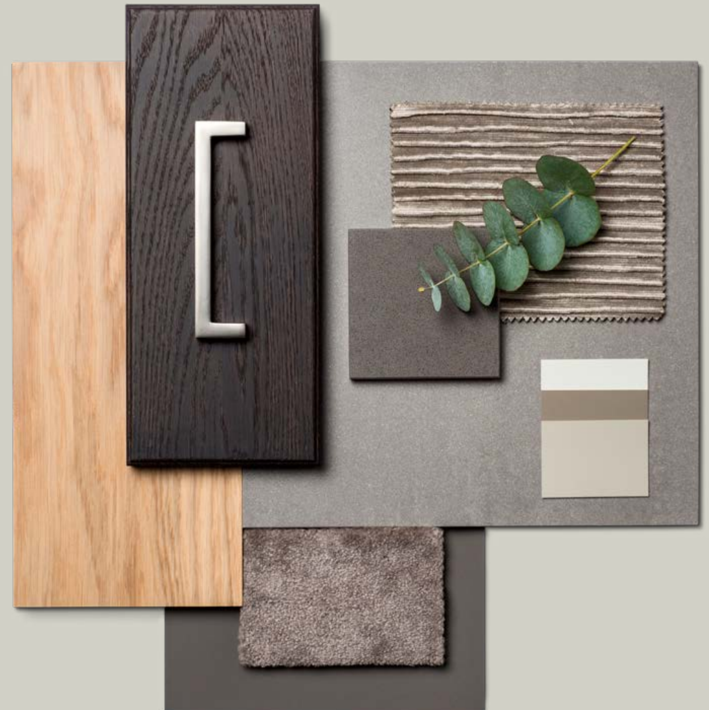
Moodboard til inspirasjon for interiørvalget. Tekstiler og tapet leveres ikke på tilvalg.