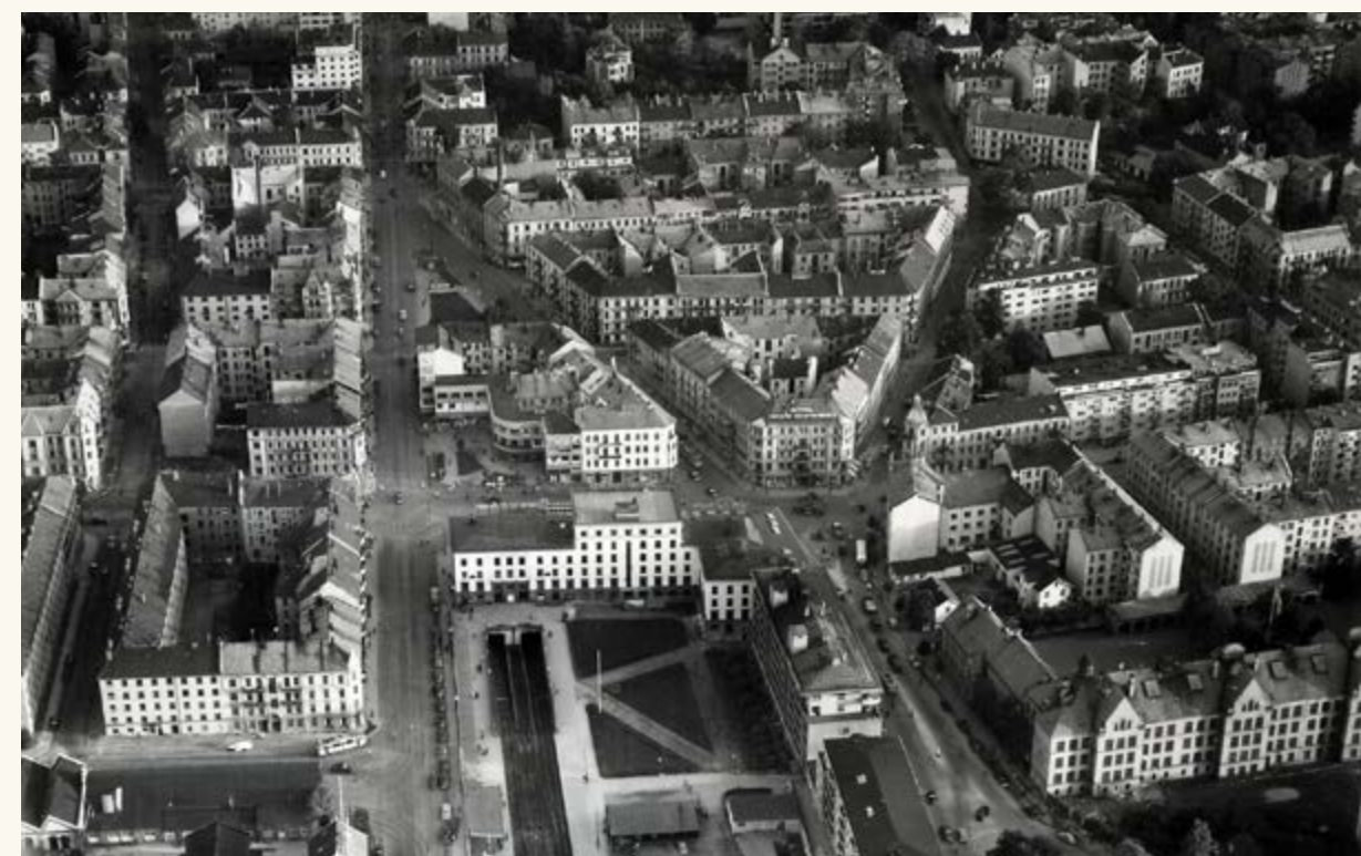
Majorstuen 1951