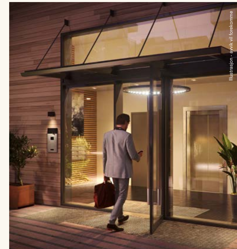
Illustrasjon - avvik vil forekomme

“Hovedmaterialet er lyse pussede flater, med innslag av metall og glass.”