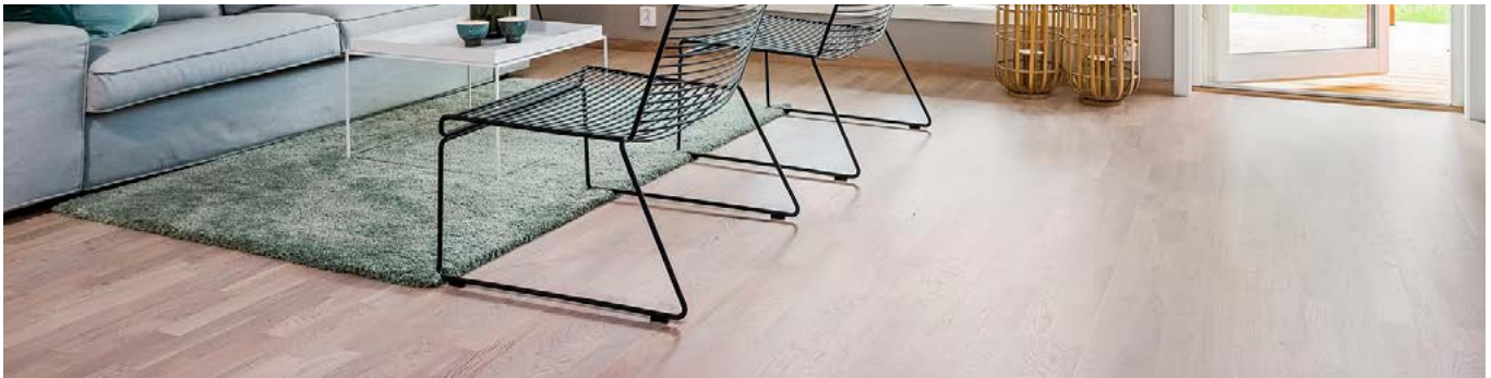
Bildet viser standardvalg Eik Taranto, 3-stav