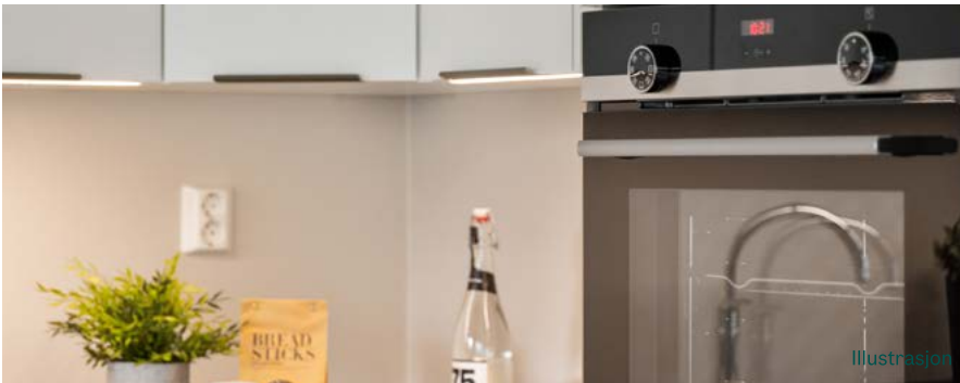
Illustrasjon av et standard kjøkken Bildet viser standard kjøkkeninnredning