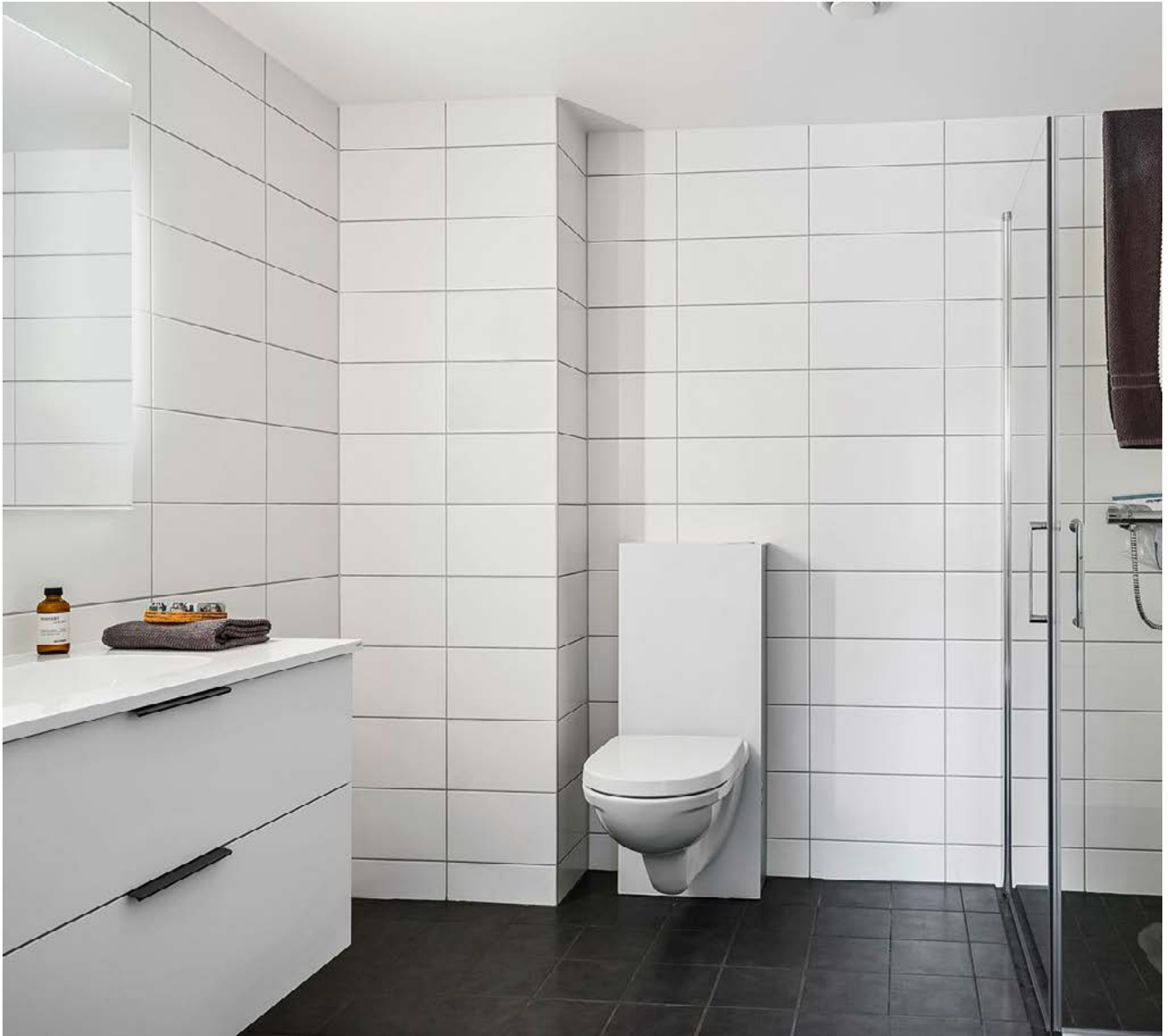
Bildet viser standard baderomsinnredning.

Tilvalg og endringer på baderomsinnredning gjøres direkte med HTH. Det avtales et møte for gjennomgang sammen med konsulent.