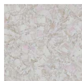
Tilvalg kr 0,- iQ Megalit 3390 604