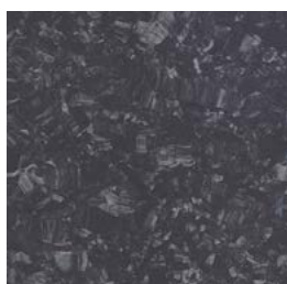
Tilvalg kr 0,- iQ Megalit 3390 601