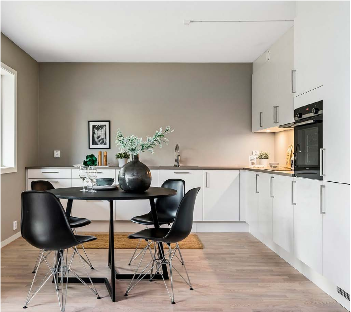
Bildet viser standard kjøkkentype.

Kjøkkeninnredningen leveres av HTH, og her får du solide løsninger som forener funksjon og spennende design. Ta kontakt for å avtale et møte for gjennomgang med konsulent.