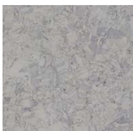
Standard iQ Megalit 3390 603

Det er gulvbelegg i 2.etg. der det er varmtvannsbereder i leilighetene.