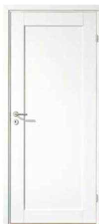
Tilvalg kr 1 226,- Unique, heltredør med ramme