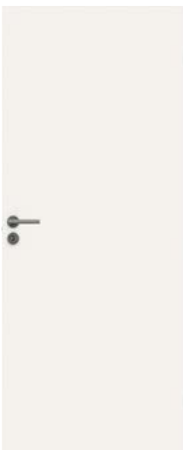
Standard Easy GW er en lett dør med slett overflate