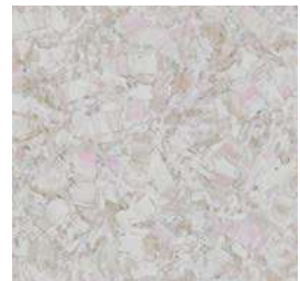
Tilvalg kr 0,- iQ Megalit 3390 604