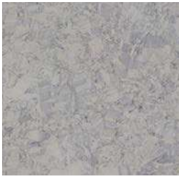
Standard iQ Megalit 3390 603

Det er gulvbelegg i 2.etg. der det er varmtvannsbereder i leilighetene.