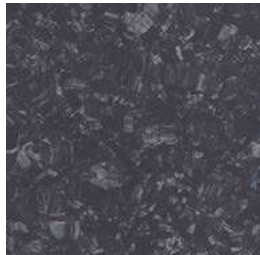
Tilvalg kr 0,- iQ Megalit 3390 601