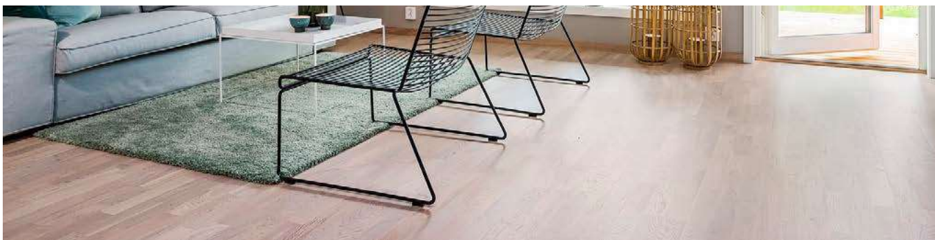
Bildet viser standardvalg Eik Taranto, 3-stav