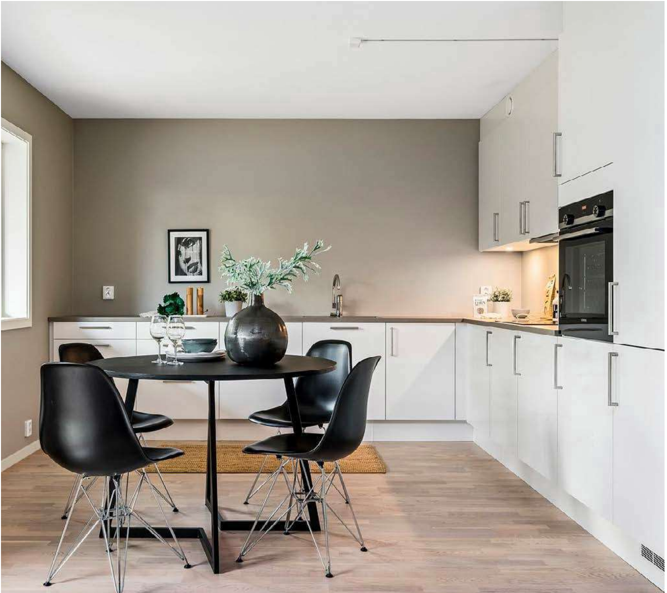
Bildet viser standard kjøkkentype.

Kjøkkeninnredningen leveres av HTH, og her får du solide løsninger som forener funksjon og spennende design. Ta kontakt for å avtale et møte for gjennomgang med konsulent.