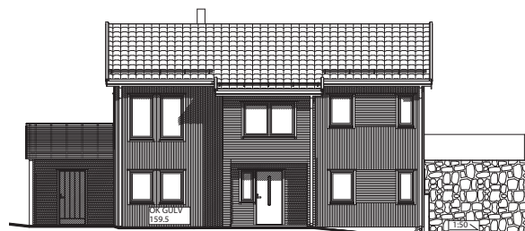
Fasade mot nordøst

Veibeskrivelse Fra E16: Ta av E16 mot Skarnes sentrum, kjør over broen. I andre rundkjøring; ta første avkjøring ut på Øgardsvegen (RV 175). Etter 1 km sving til venstre inn på Holtvegen. Etter 1 km sving til venstre inn på Damlivegen. Ta første til venstre og du er på Damlitoppen.