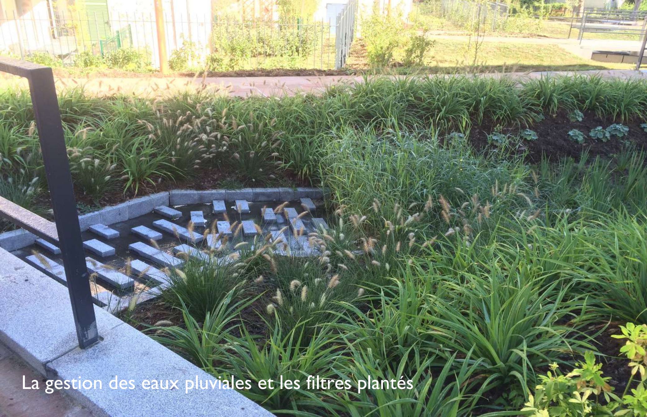
La gestion des eaux pluviales et les filtres plantés