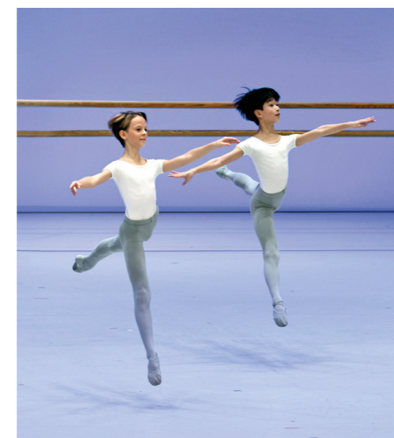
Démonstrations, École de danse de l'Opéra de Paris