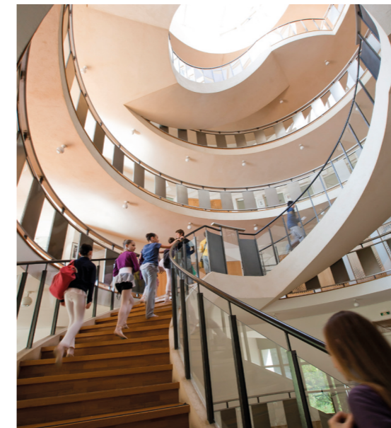
École de danse de l'Opéra national de Paris