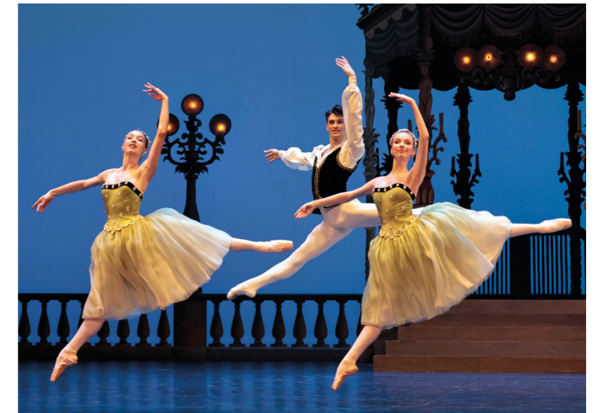
Soir de fête (Léo Staats), École de Danse de l'Opéra de Paris

Élisabeth Platel Directrice de l'École de danse