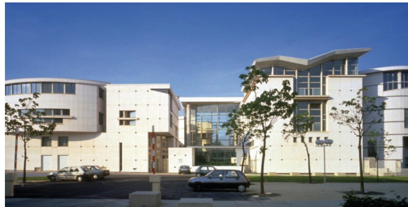
École de danse de l'Opéra national de Paris

Située autrefois au sein du Palais Garnier, l'École de danse a déménagé en 1987 à Nanterre, à deux pas du parc André Malraux. Conçu par l'architecte Christian de Portzamparc, le bâtiment qui l'abrite offre aux 150 élèves un environnement idéal pour un enseignement d'excellence alliant tradition et ouverture sur le monde. Considérée comme l'une des meilleures écoles de danse au monde, elle forme l'immense majorité des danseurs et danseuses du Ballet de l'Opéra national de Paris.