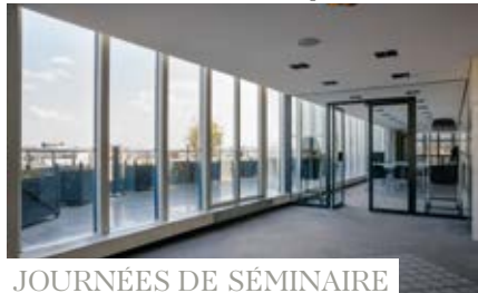
JOURNÉES DE SÉMINAIRE