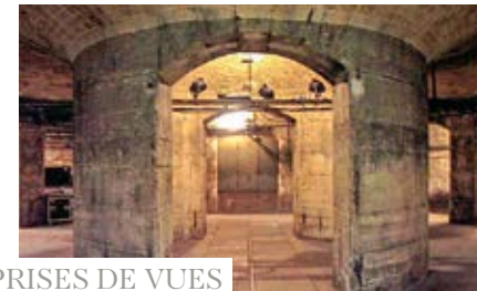
Rotonde en cave Palais Garnier