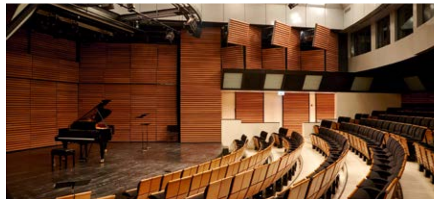
LE STUDIO BASTILLE