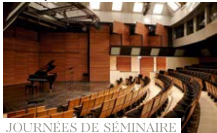
JOURNÉES DE SÉMINAIRE