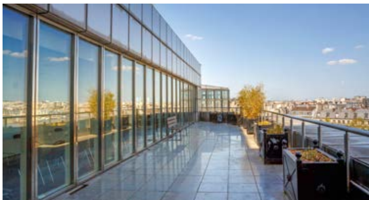
LA TERRASSE DU 7 e ÉTAGE

Facilement accessible depuis la Défense et l'Ouest parisien par la ligne 1 du métro, et tout proche des gares de Lyon et d'Austerlitz, l'Opéra Bastille offre des espaces parfaitement adaptés à des réunions et séminaires dans un cadre culturel unique au monde. Nous vous proposons ainsi deux formules pour vos journées de travail, à adapter selon votre format.