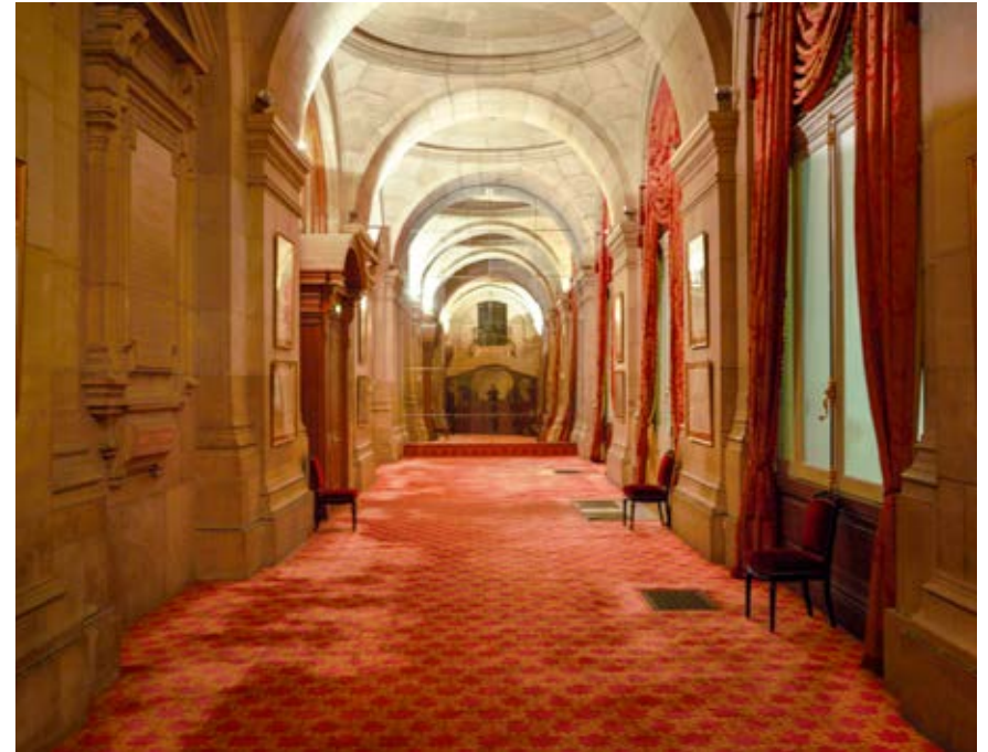
SALON FLORENCE GOULD

Galerie aux larges baies vitrées qui lui apportent de la lumière, ce salon est le lieu privilégié pour l'organisation de cocktails, soupers et conférences.