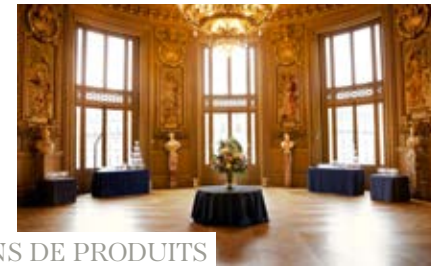
Rotonde du Glacier Palais Garnier