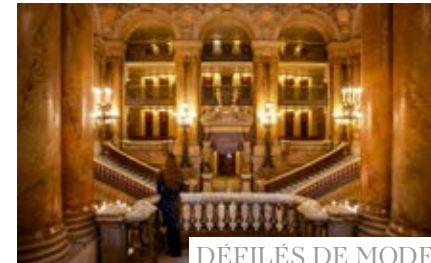
DÉFILÉS DE MODE