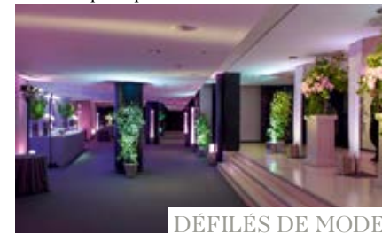
DÉFILÉS DE MODE