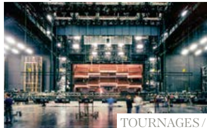
TOURNAGES / PRISES DE VUES