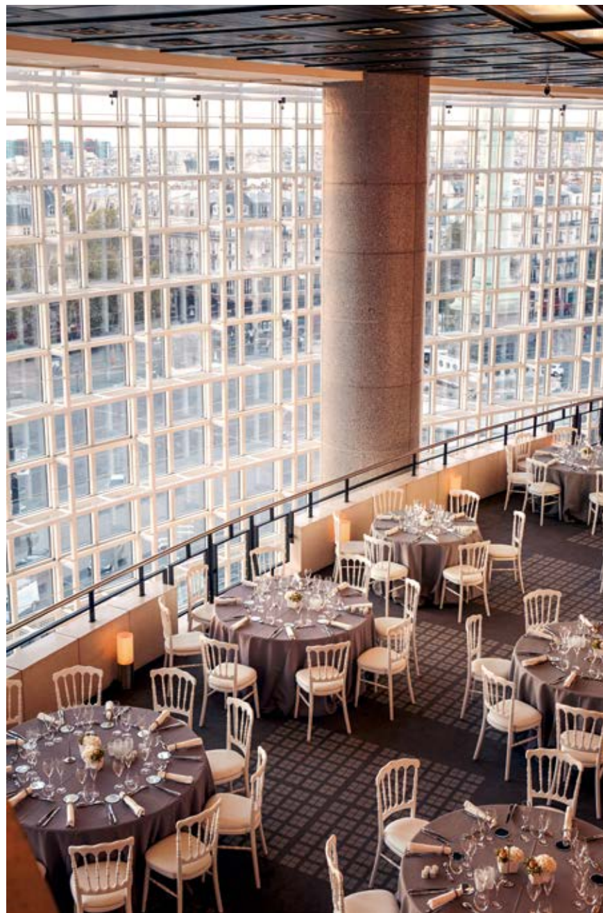
LE FOYER PANORAMIQUE

Tels des loges accrochées aux escaliers, dans l'épaisseur de la façade, les boucliers sont des salons à demi-ouverts sur les espaces publics, offrant l'intimité nécessaire à l'organisation de cocktails pendant les entractes des spectacles.