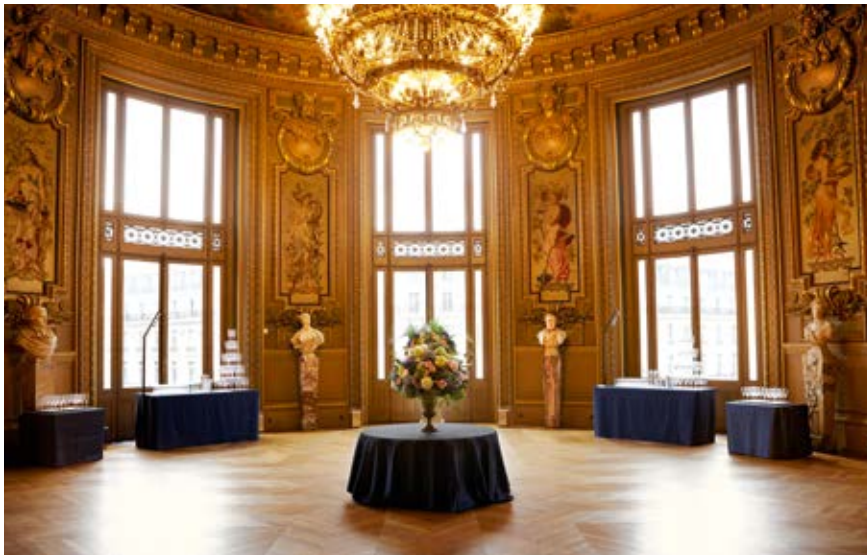
LA ROTONDE DU GLACIER