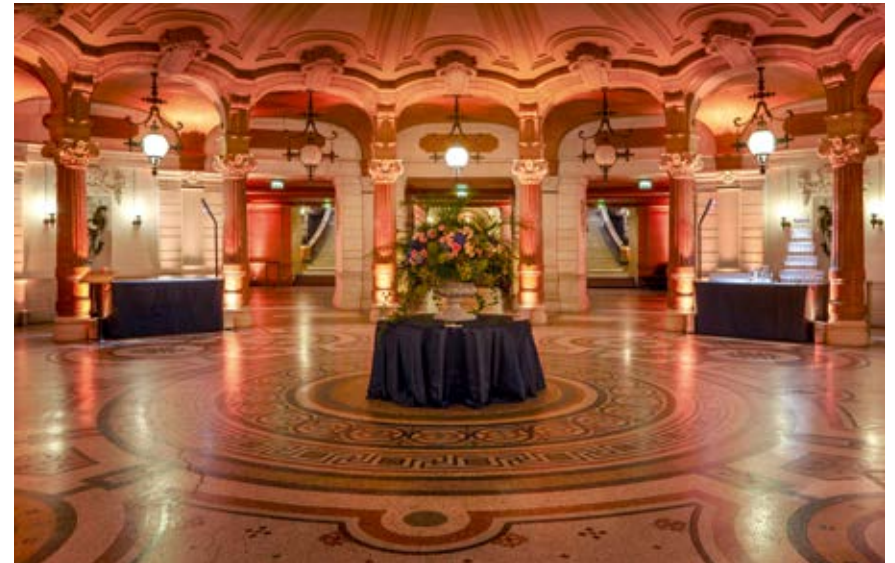
ROTONDE DES ABONNÉS