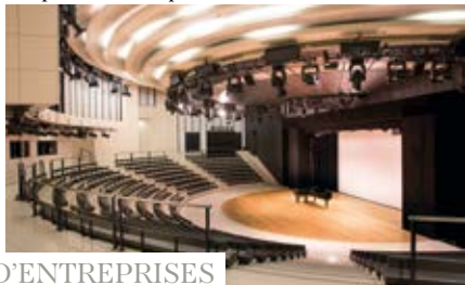
Amphithéâtre Opéra Bastille