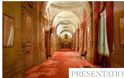
PRÉSENTATIONS DE PRODUITS