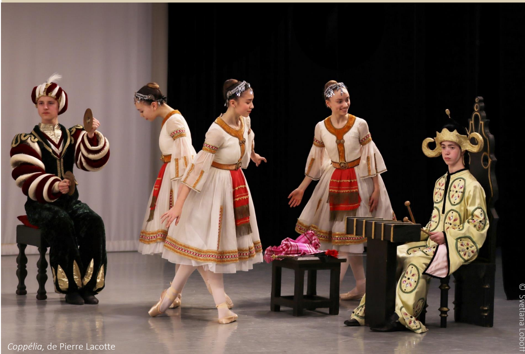
Coppélia, de Pierre Lacotte