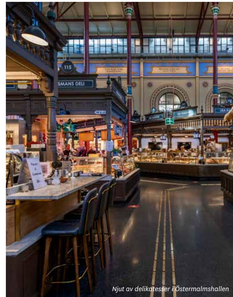
Njut av delikatesser i Östermalmshallen