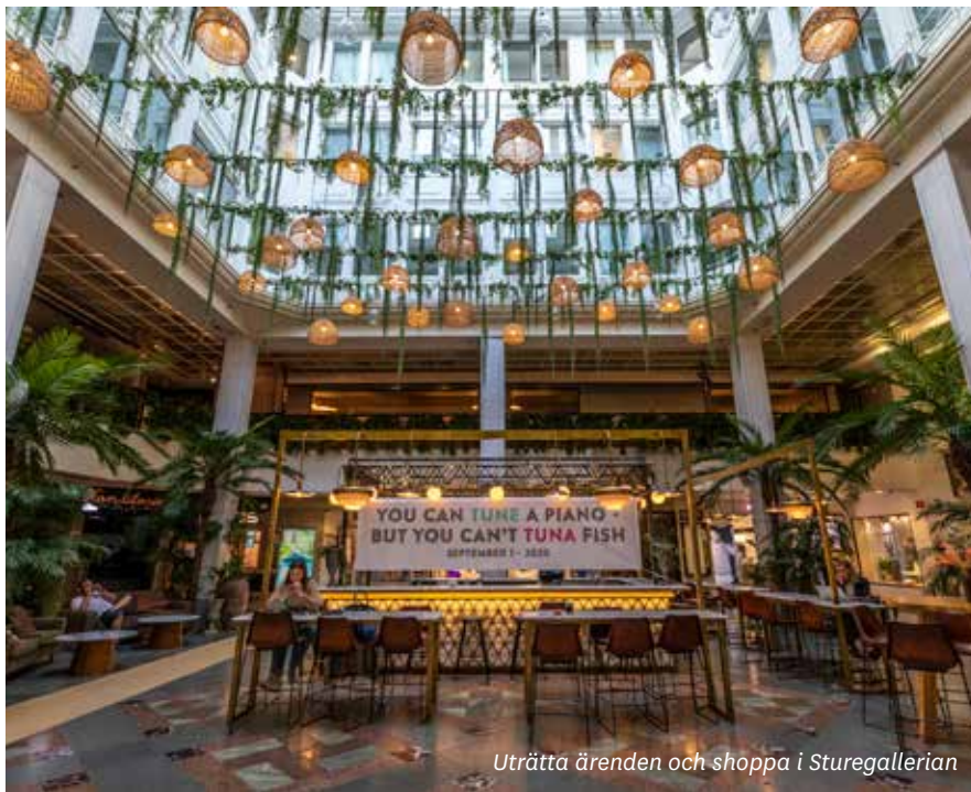
Uträtta ärenden och shoppa i Sturegallerian