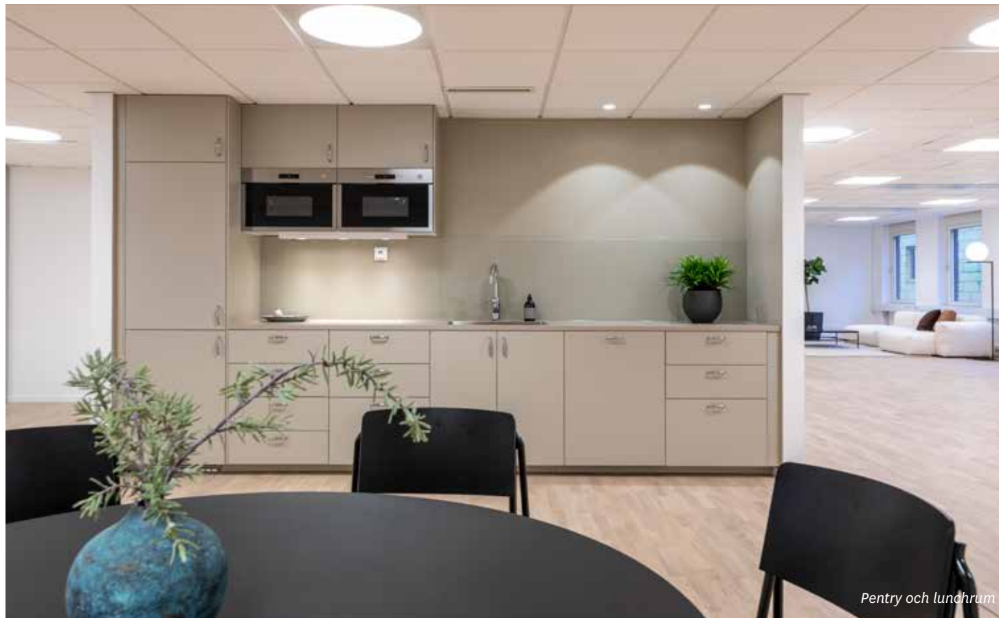
Pentry och lunchrum