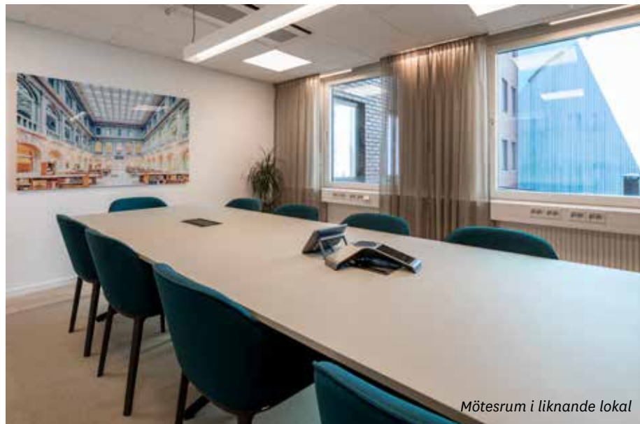
Mötesrum i liknande lokal