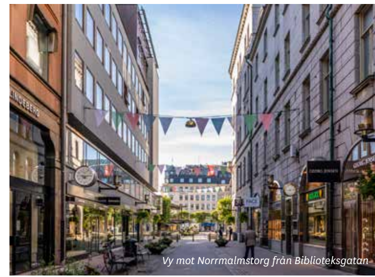
Vy mot Norrmalmstorg från Biblioteksgatan