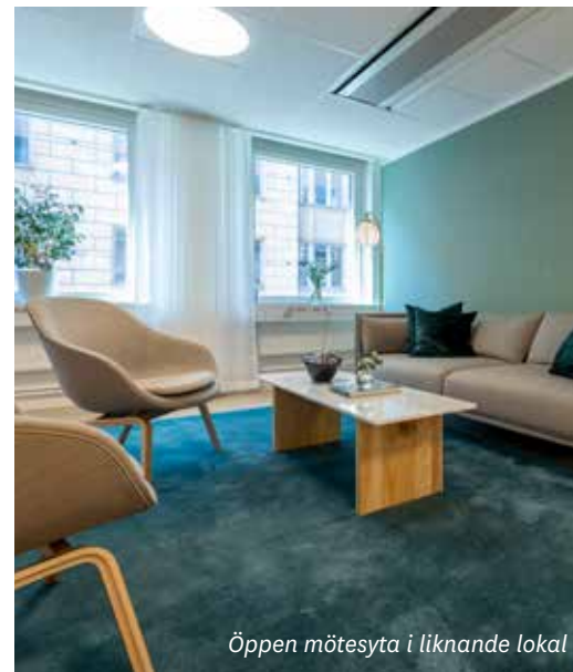
Öppen mötesyta i liknande lokal