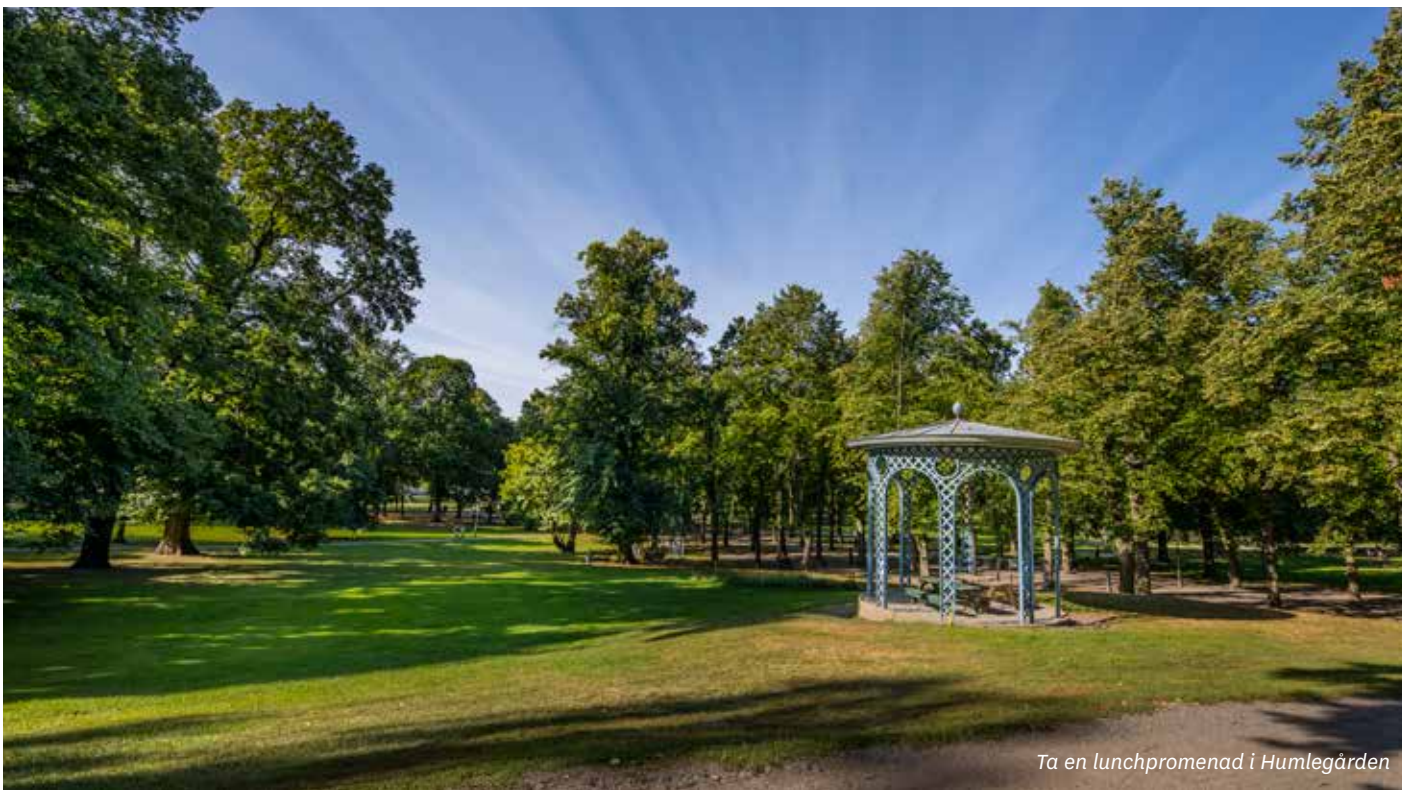
Ta en lunchpromenad i Humlegården