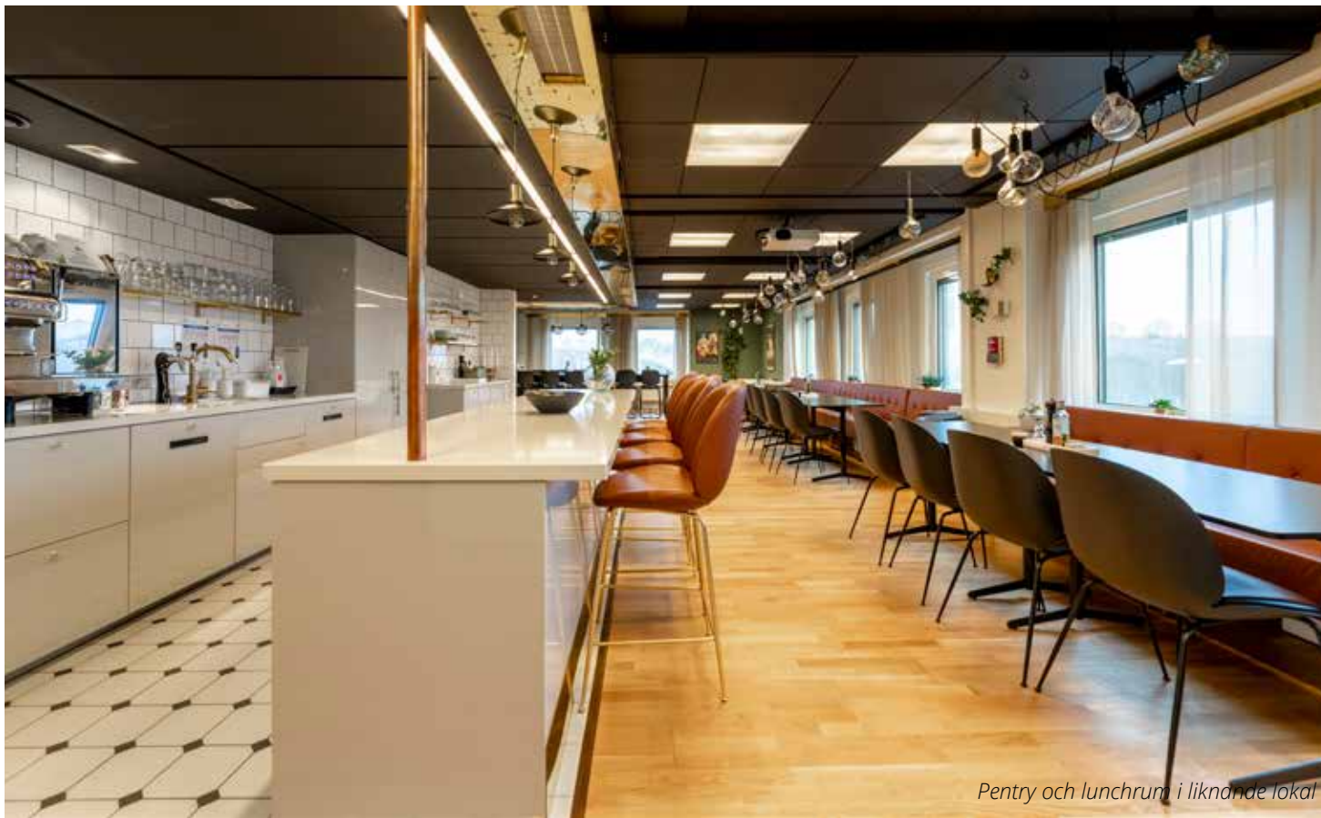
Pentry och lunchrum i liknande lokal