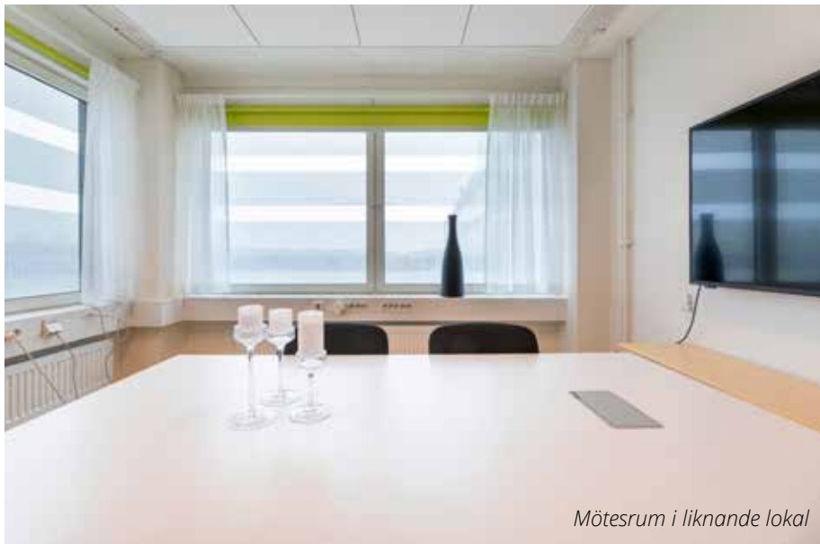
Mötesrum i liknande lokal