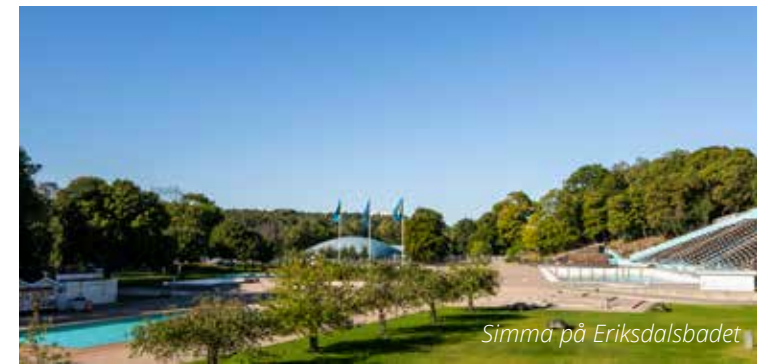
Simma på Eriksdalsbadet