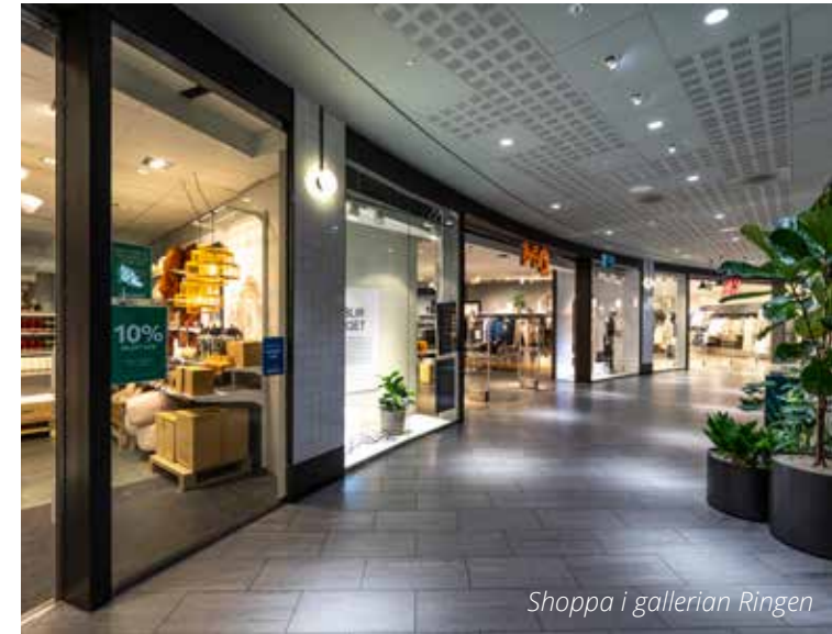
Shoppa i gallerian Ringen