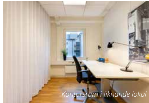
Kontorsrum i liknande lokal