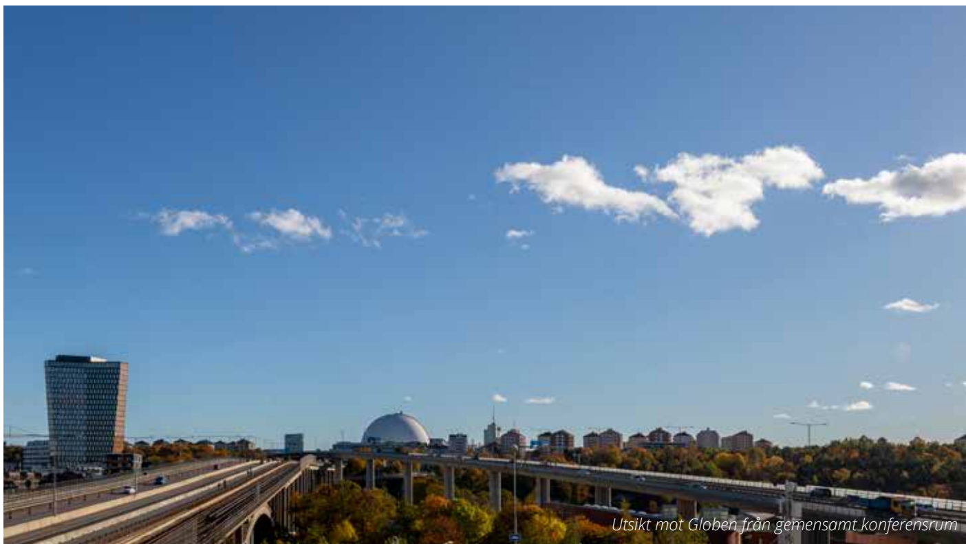
Utsikt mot Globen från gemensamt konferensrum