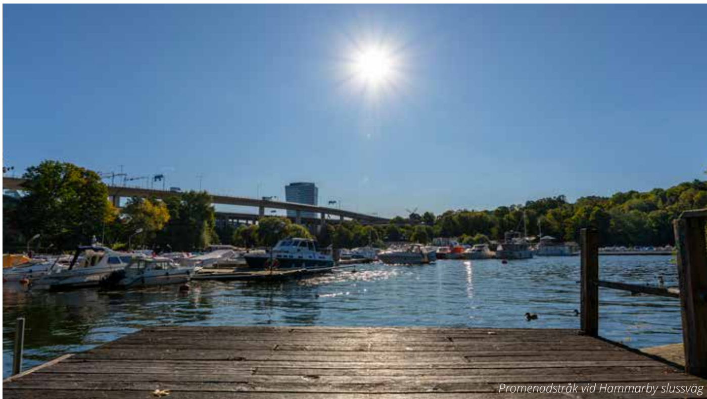
Promenadstråk vid Hammarby slussväg