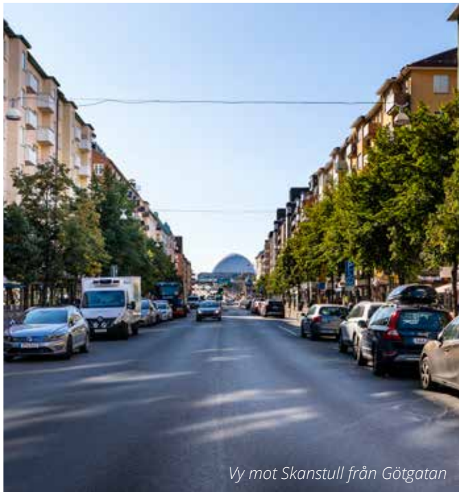
Vy mot Skanstull från Götgatan