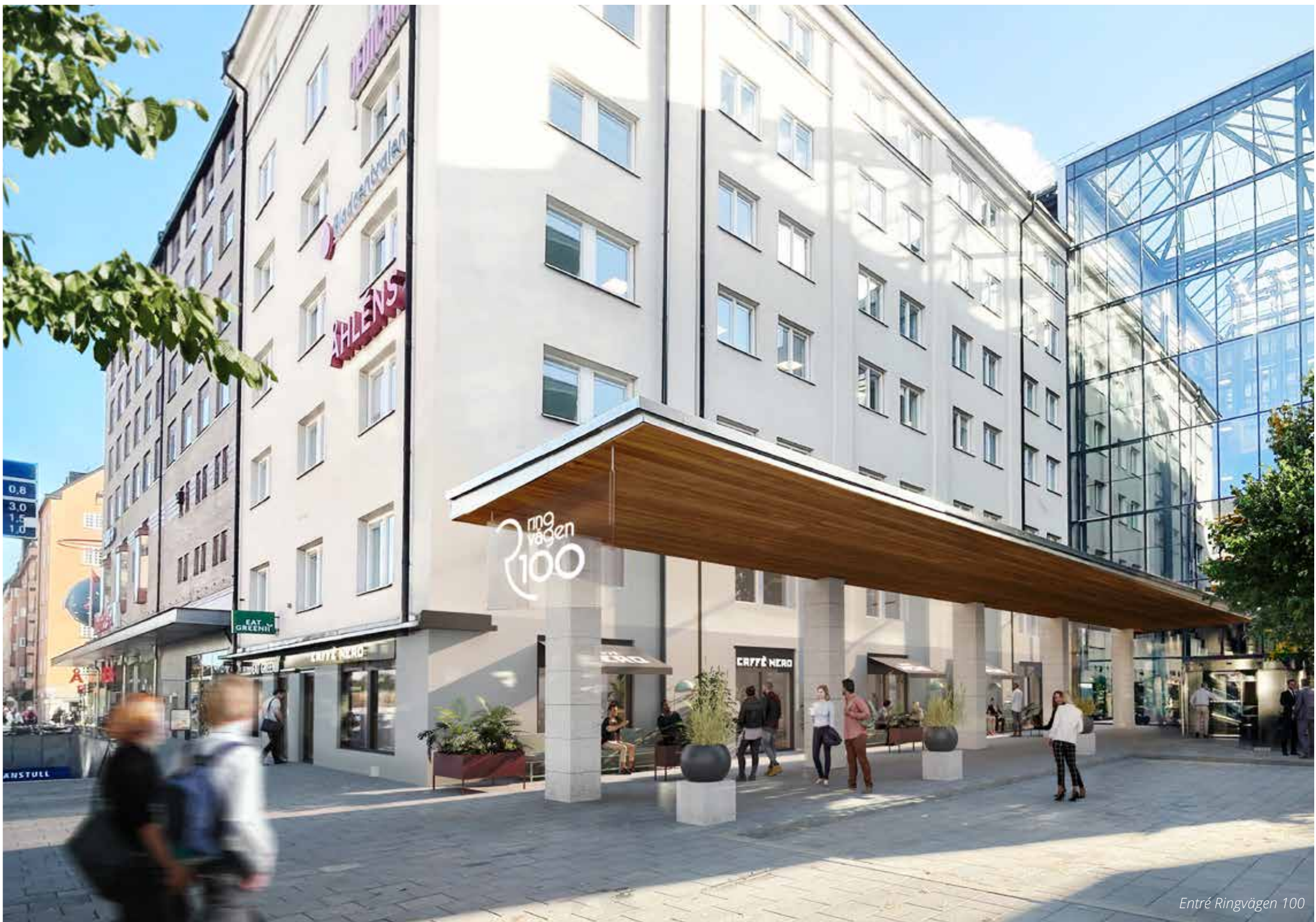
Entré Ringvägen 100