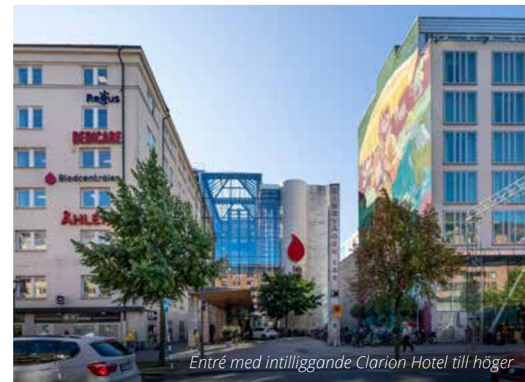
Entré med intilliggande Clarion Hotel till höger