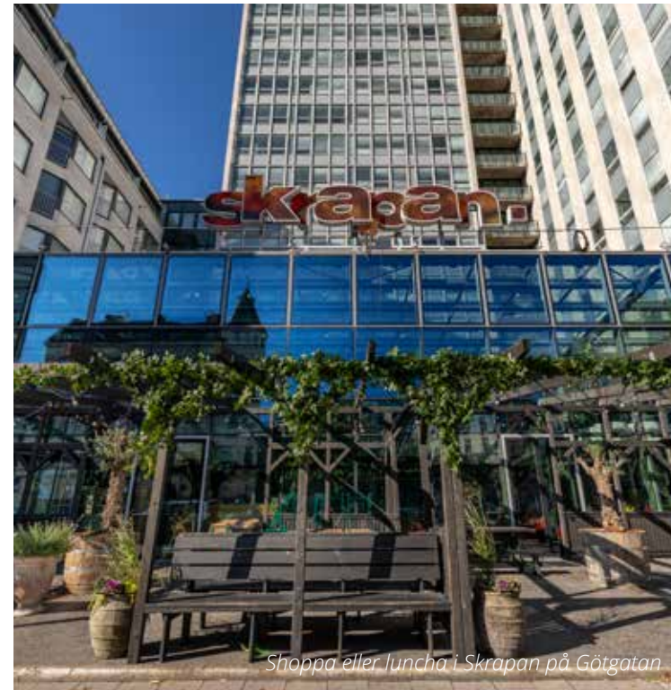
Shoppa eller luncha i Skrapan på Götgatan