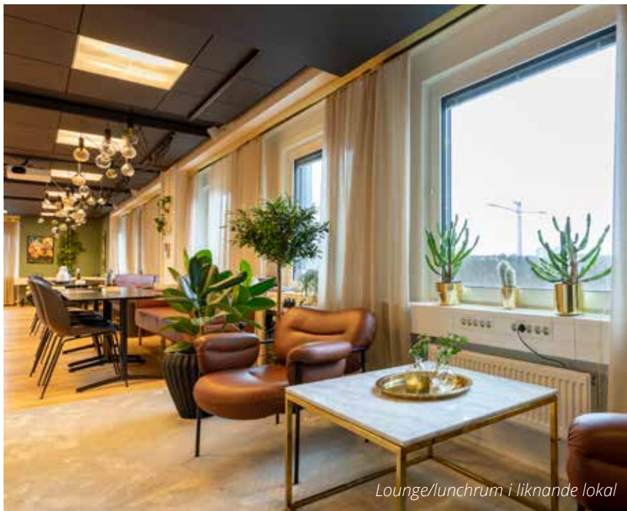
Lounge/lunchrum i liknande lokal