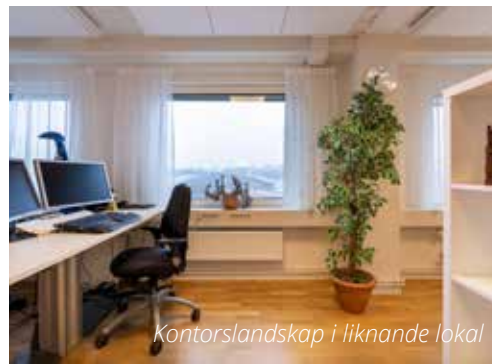
Kontorslandskap i liknande lokal