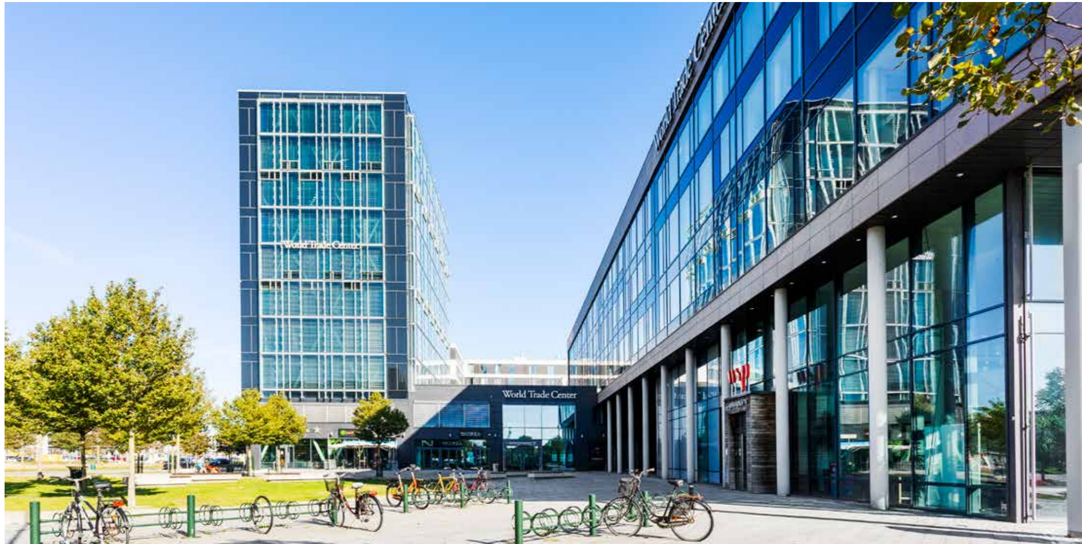
WORLD TRADE CENTER på Jungmansgatan 12 i MALMÖ, Gröna lansen 2010 (Malmö stads pris för värdefullt tillskott till stadsmiljön).