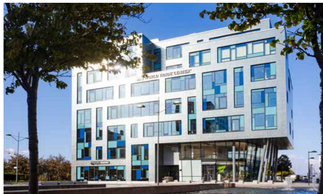
WORLD TRADE CENTER på Propellergatan i Malmö.

The Edge utvecklas av Granitor Properties. För oss är det en självklarhet att skapa miljövänliga, energisnåla lösningar – både när det gäller byggprocessen i sig och de färdiga byggnaderna.