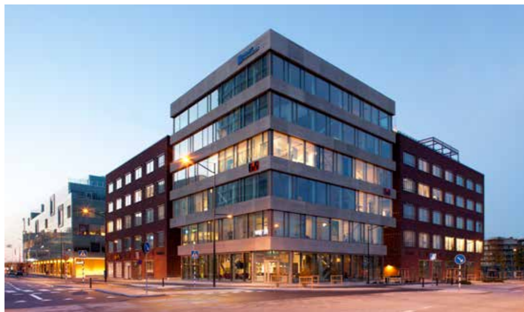
HERMOD, Miljöbyggnad Silver samt BREEAM, certified Very Good.