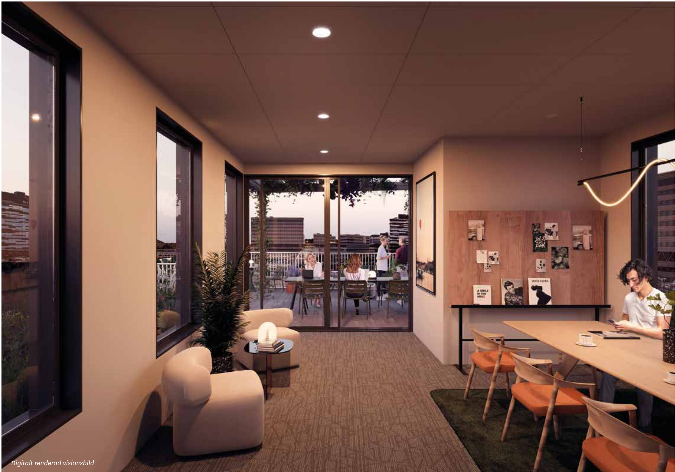
Digitalt renderad visionsbild