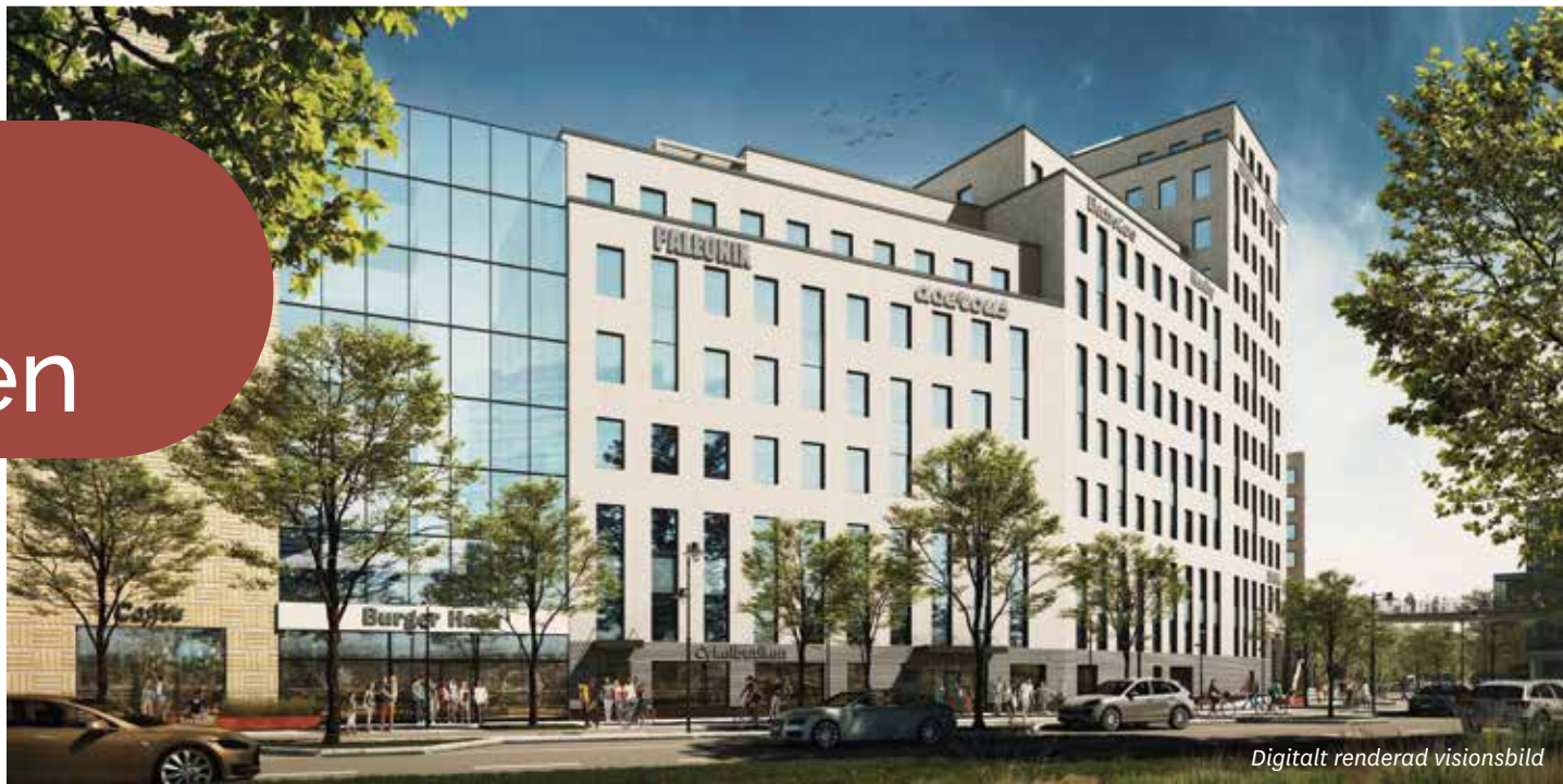
Digitalt renderad visionsbild