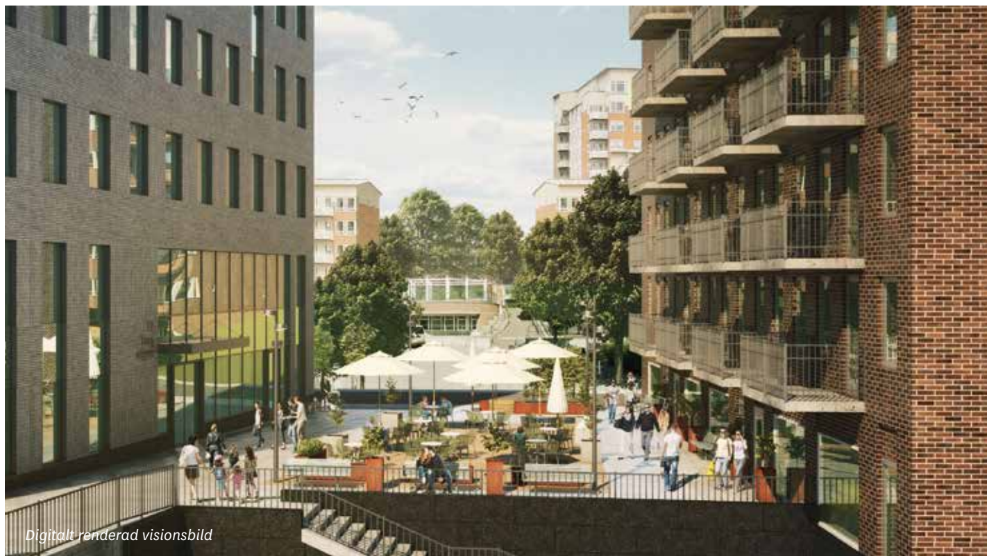
Digitalt renderad visionsbild