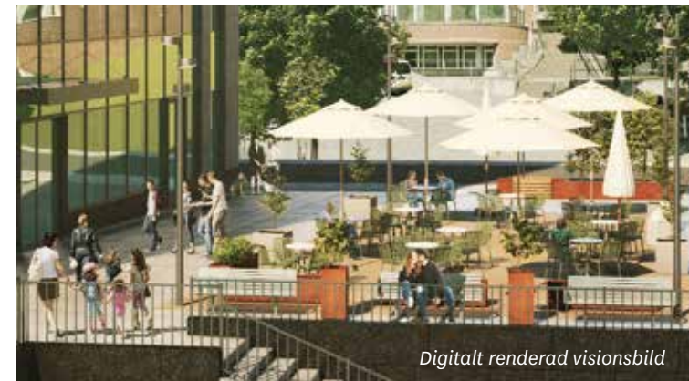
Digitalt renderad visionsbild