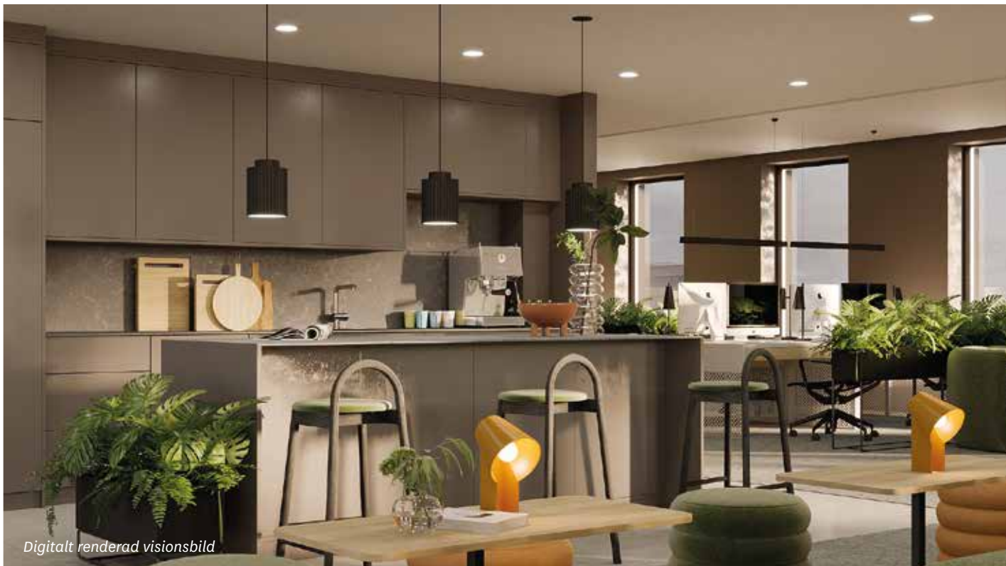
Digitalt renderad visionsbild