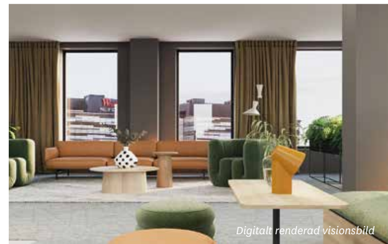
Digitalt renderad visionsbild