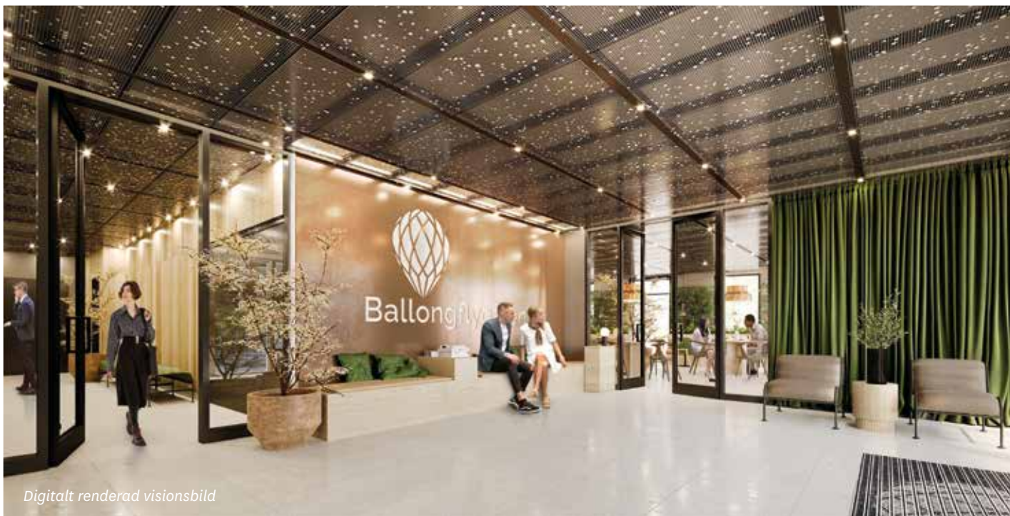
Digitalt renderad visionsbild