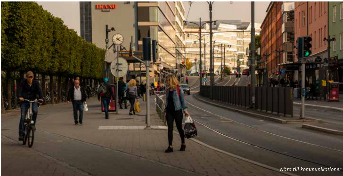
Nära till kommunikationer