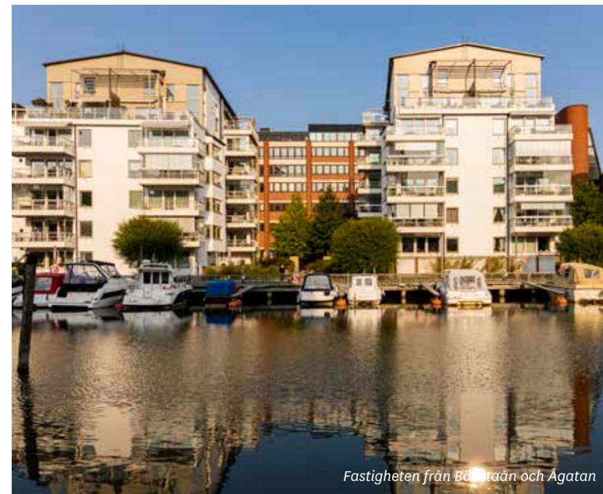
Fastigheten från Bällstaån och Ågatan