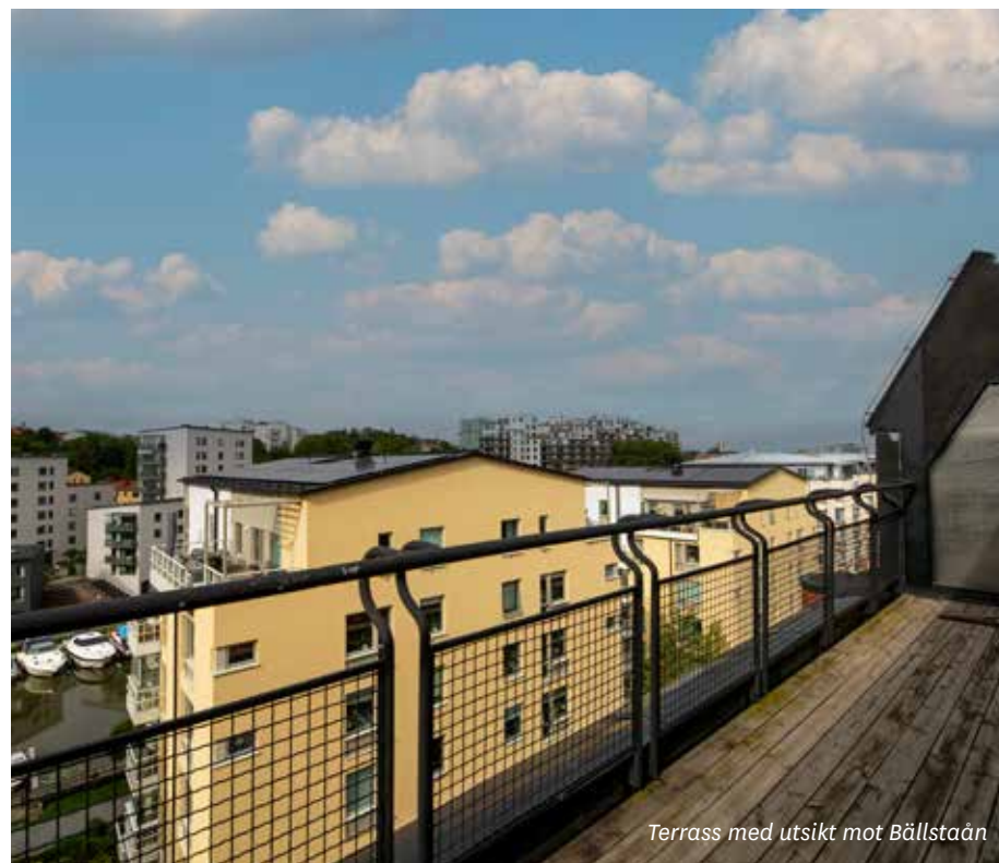
Terrass med utsikt mot Bällstaån