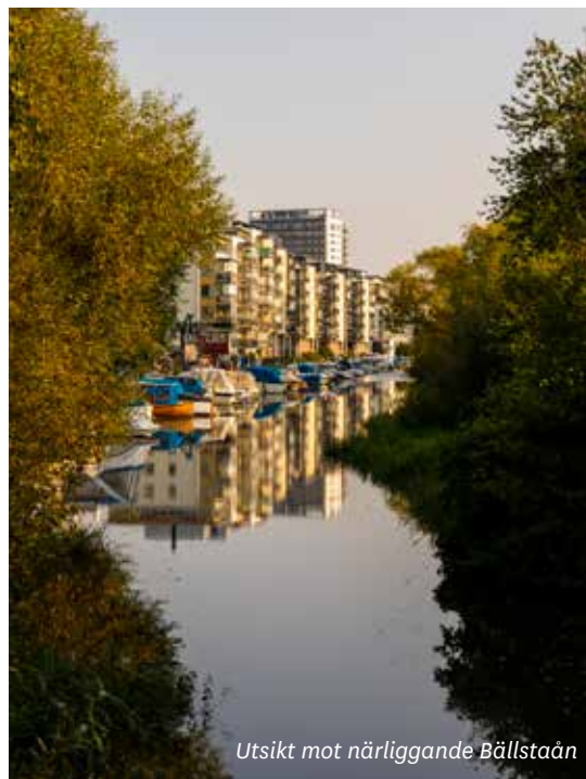
Utsikt mot närliggande Bällstaån