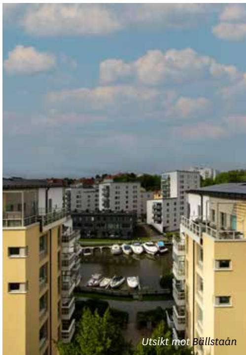
Utsikt mot Bällstaån