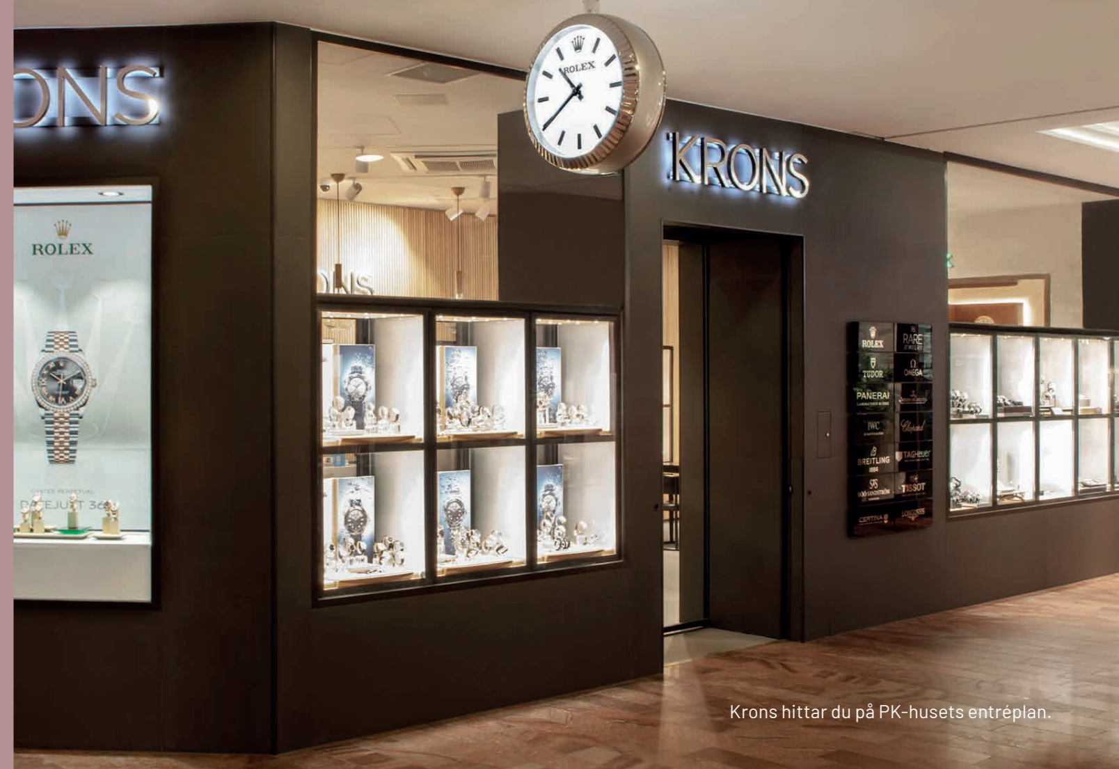
Krons hittar du på PK-husets entréplan.