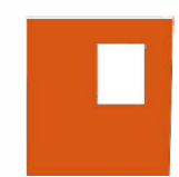
Lokalen i huset