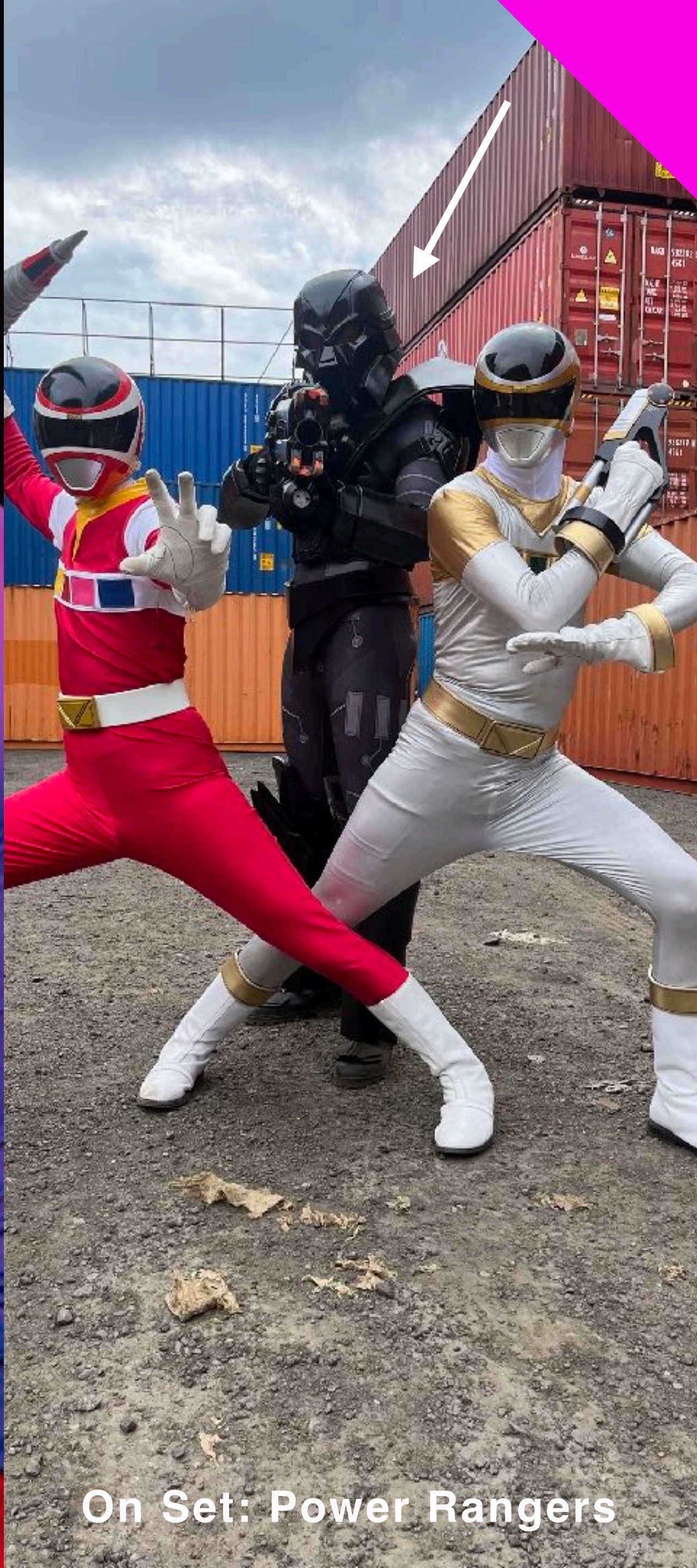
On Set: Power Rangers