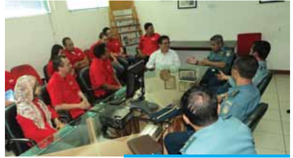
Ketua Kadispnal Laksamana Pertama Untung Suropati dan Bpk Karni Ilyas selaku pemred tvOne sedang berbincang dalam acara kunjungan ke tvOne pada tanggal 17 Januari 2012, juga hadir Bpk Toto Suryanto beserta rekan redaksi lainnya.