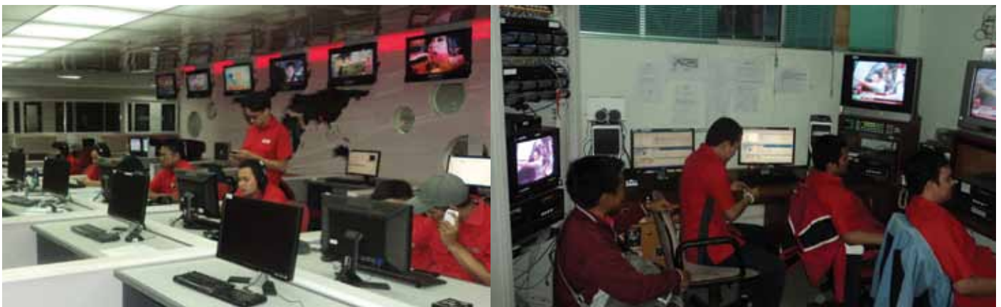
Suasana di Ruang News Room dan ruangan Dalet tvOne

Adakah kelemahan dari newsroom system ini? Tentu saja ada. Seperti kata pepatah tak ada gading yang tak retak. Dalam prakteknya ada saja masalahnya, mulai dari server hang sampai clib video yang hilang di sistem.