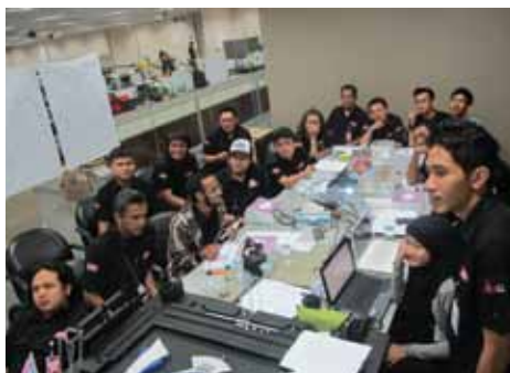
Suasana rapat produksi Samudra Karya 19 HUT ANTV

Tim Produksi On Air bekerja keras mempersiapkan pentas hiburan dengan dukungan banyak artis terkenal seperti Geisha, Sm*sh, D'Massive, Syahrini, Wali, Cherry Belle dan masih banyak lagi serta diitujung dengan berbagai teknologi panggung hiburan tercanggih diantaranya; sling, hidrolik, rotater, moving stage, pop up stair dan lampu-lampu laser yang super keren. Tata lampu dan panggung yang futuristik akan dibangun dengan konsep indoor dan outdoor menjanjikan pentas musik paling spektakuler di tahun ini. [/lia/]