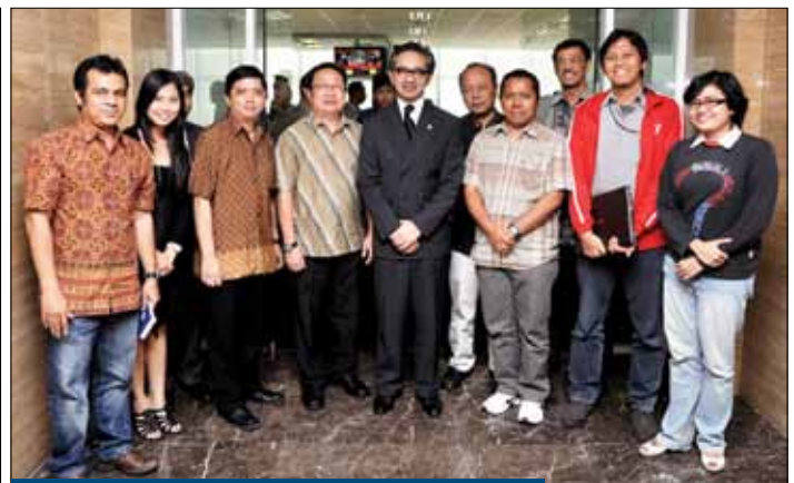
Menteri Luar Negeri Marty Natalegawa bersama awak redaksi

Kehadiran para tokoh bertambah panjang. Catatan dua bulan terakhir, belasan tamu mendatangi kantor VIVAnews di Menara Standar Chartered, Jalan Satrio, Jakarta. Baik menteri, wakil menteri, Gubernur, rektor hingga pimpinan perusahaan. Tamu terakhir yang mengunjungi VIVAnews adalah Gubernur DKI Jakarta, Fauzi Bowo.