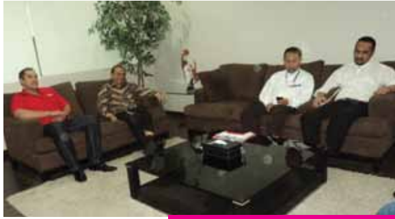
Pimpinan KPK baru Abraham Samad dan Busyro Muqoddas berkunjung ke tvOne pada hari Jumat, 27 Januari 2012.