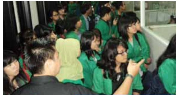
Mahasiswa Universitas Nasional melakukan tour ke news room tvone setelah sebelumnya mendapatkan materi mengenai tvOne.