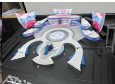
Maket panggung indoor Samudra Karya HUT 19 ANTV