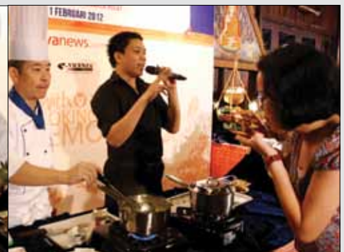
Seorang peserta menyicipi makanan saat demo masak "Cook for Love With Thai Cuisine"