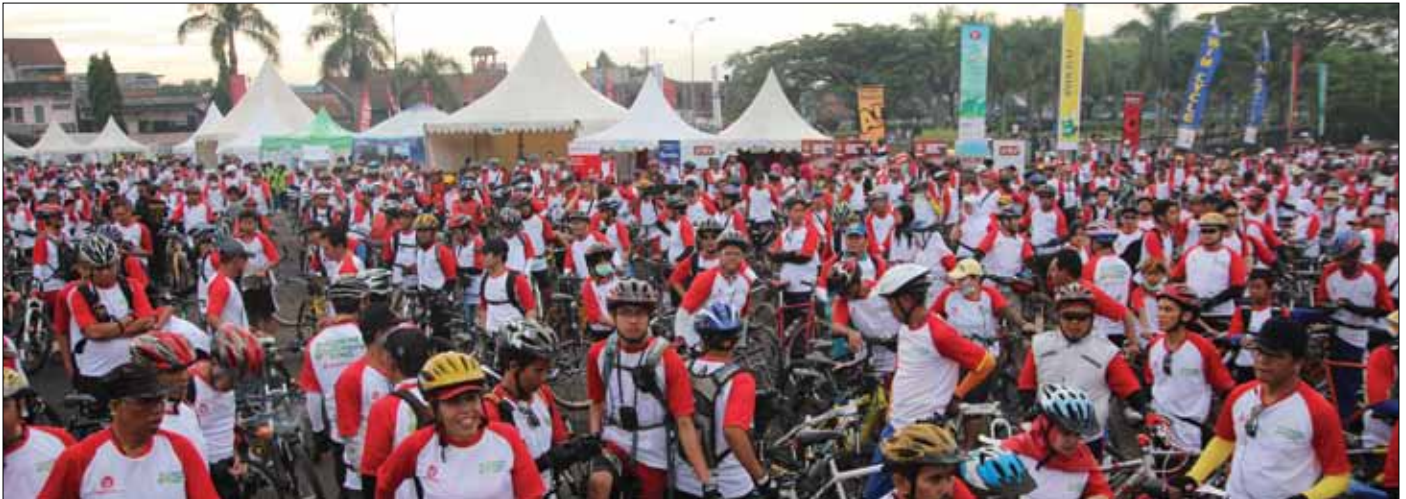
Ribuan peserta funbike persiapan berangkat di Monumen Perjuangan, Bandung