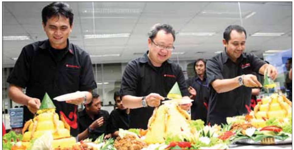
Pemotongan tiga tumpeng nasi kuning.

Penghujung tahun 2011, VIVAnews meluncurkan situs khusus sepakbola VIVAbola. Peluncuran berlangsung sederhana, bertempat di kantor redaksi VIVAnews, Menara Standchart Lantai 31, Jalan Satrio, Jakarta, 17 Desember 2012 lalu. Acara bersamaan dengan syukuran HUT VIVAnews yang ketiga.