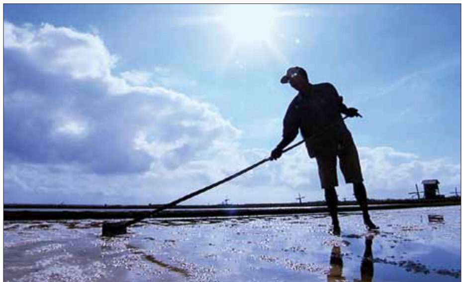
Cuplikan Program Bumi & Manusia