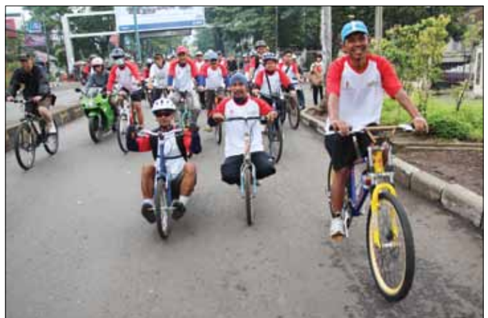
Sepeda "goyang" ikut memeriahkan funbike