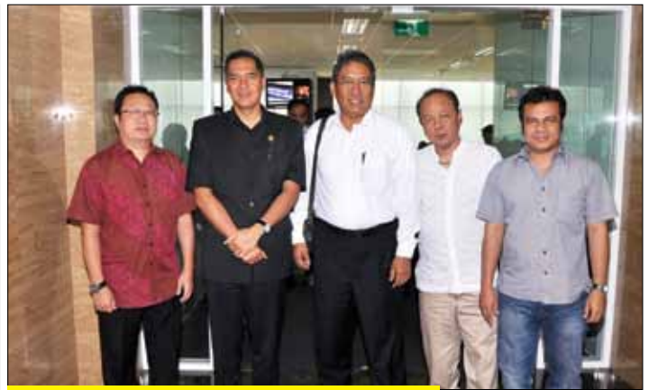
Menteri Perdagangan Gita Wirjawan dan Wakil Menteri Perdagangan Bayu Krisna Mukti juga menyambangi VIVAnews