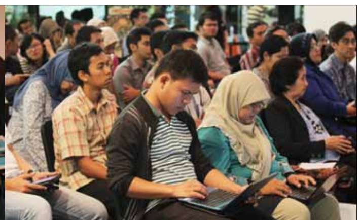
Temu blogger di FX Plaza