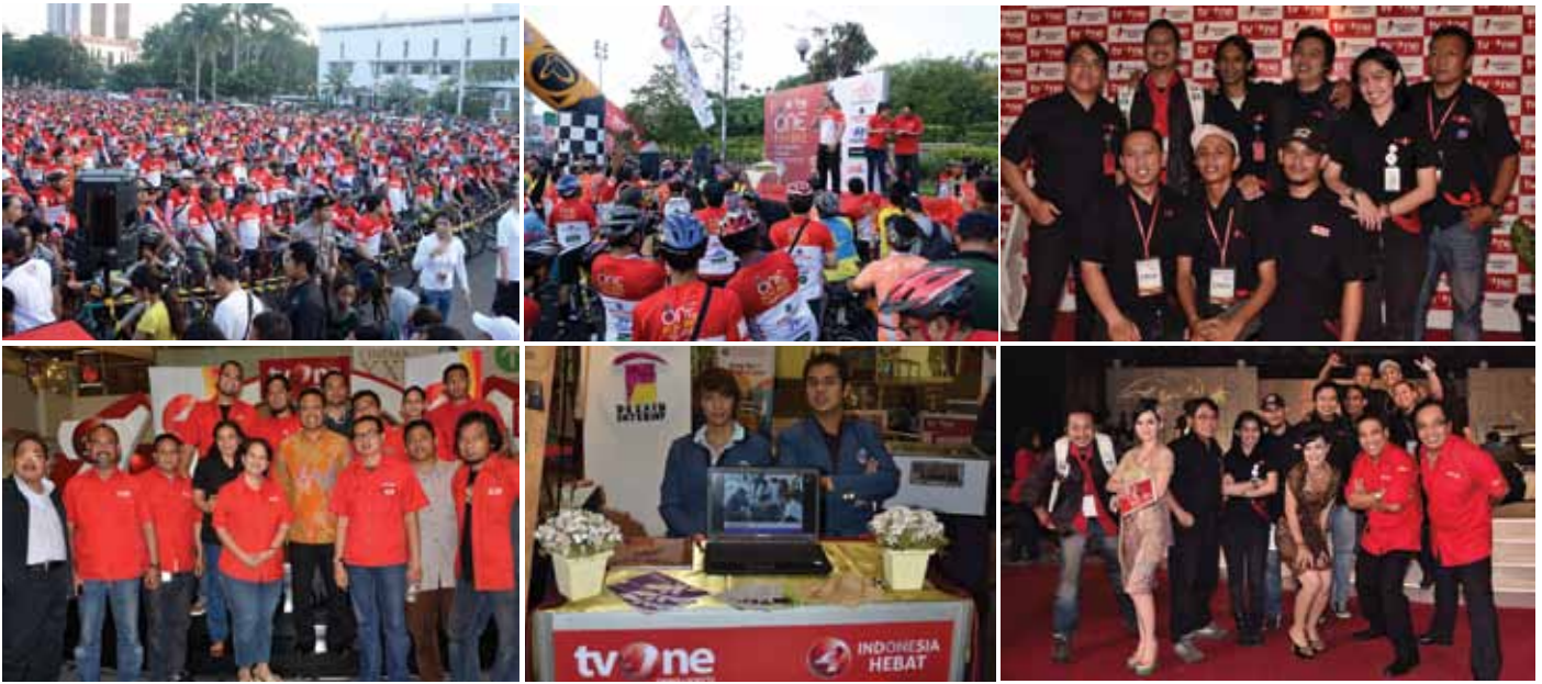
Kemeriahan dan semarak Indonesia Hebat di Ulang Tahun tvOne ke-4

langsung dari Surabaya. Program-program tersebut adalah Indonesia Lawyers Club, Damai Indonesiaku dan Apa Kabar Indonesia Weekend. Bisa dipastikan pada akhir Februari dan awal