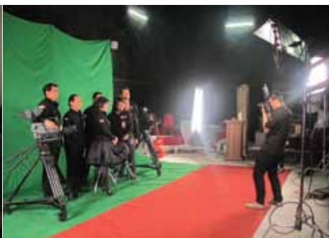
Behind the scene pemotretan direksi untuk Buku "19 Tahun Wow Kereeen...!"