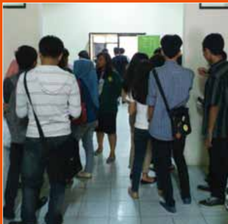
Mahasiswa UNJ antusias masuk ruang seminar