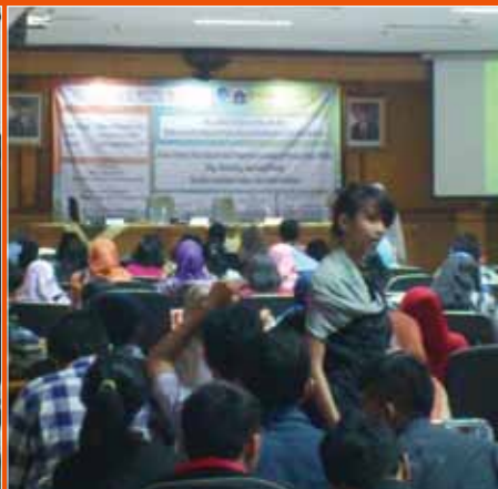
Pemaparan materi seminar seputar marketing online.