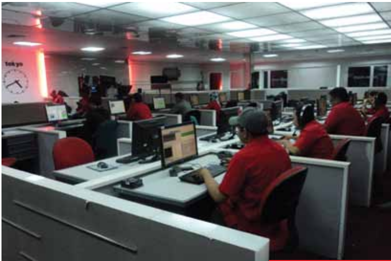
Aktivitas di Ruang News Room

Tak bisa disangkal, siaran televisi memiliki kelebihan soal kecepatan sampai kepada pemirsa. Siaran televisi menembus ruang dan waktu. Di mana saja orang bisa mengakses dengan mudah dan cepat. Segala peristiwa, bisa disajikan secara langsung alias real time.