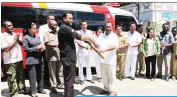
ANTV Peduli Untuk Negeri melunasi kewajiban penyaluran dana sumbangan pemirsa ANTV untuk korban bencana banjir bandang di Wasior, Papua yang terjadi pada 4 Oktober 2010 silam dalam bentuk satu unit mobil ambulance beserta perlengkapan alat kesehatan yang diberikan kepada Puskesmas Wondiboy, yaitu Puskesmas yang terletak di Teluk Wondama, Wasior. Ambulance diterima langsung oleh Bupati Teluk Wondama, Wasior Bapak Drs. Alberth H. Torey, MM pada Kamis, 26 Januari 2012.