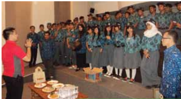
Penyambutan kunjungan dari SMK Pasundan pada 18 Januari 2012, sekaligus pemberian materi mengenai tvOne.