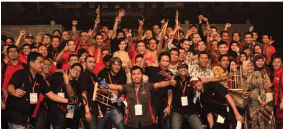
Foto Bersama sesuai acara Hut ke-4 tvOne yang diselenggarakan pada tanggal 2 Maret 2012 di Balai Kartini.

Indonesia hebat. Mungkinkah masih banyak yang menyangsikan itu? Bisa saja jawabnya, YA, dengan argumentasi masih banyaknya persoalan yang dialami bangsa ini. Sebut saja korupsi, kemiskinan, kelaparan dan keterbelakangan. Namun optimisme terhadap pernyataan Indonesia hebat didukung pula oleh banyak fakta berupa karya anak bangsa, baik di skala regional maupun internasional yang terekam di dalam sejarah bangsa ini.