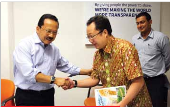
Gubernur DKI Jakarta Fauzi Bowo beri kenang-kenangan buku.

Mendapatkan informasi langsung dari sumber pertama menjadi target jurnalis VIVAnews. Selain mendatangi narasumber untuk mendapatkan informasi lengkap dan akurat, juga berusaha mendatangkan para narasumber ke kantor. Alhasil, sejak VIVAnews didirikan tiga tahun lalu, tamu tokoh penting silih berganti berkunjung ke VIVAnews.