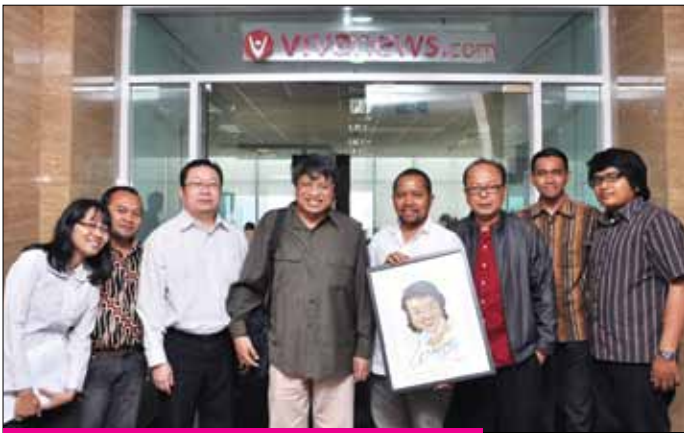
Wakil Menteri ESDM Widjajono Partowidagdo bertandang ke VIVAnews

VIVAnews. Dahlan Iskan, yang juga mantan wartawan selain bertamu, juga sering membuat kolom yang dikirim ke VIVAnews.