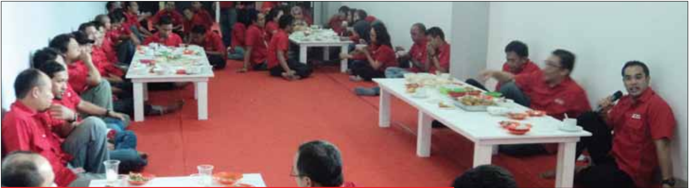
Suasana acara 3 in 1 yang menjadi tujuan acara tersebut menciptakan suasana santai dengan duduk lesehan dan menyajikan banyak jajanan pasar.

Berkumpul, santai, ngobrol-ngobrol bersama Pak Ardi secara informal adalah sebuah pengalaman yang menarik. 3 In 1, konsep tersebut dibuat oleh HCD (Human Capital Development) Department untuk membuka jalur komunikasi antara Bapak Ardiansyah Bakrie sebagai CEO tvOne dengan karyawan untuk menyampaikan keluhan, aspirasi, maupun pertanyaan yang dapat disampaikan secara langsung tanpa melewati prosedur struktural.