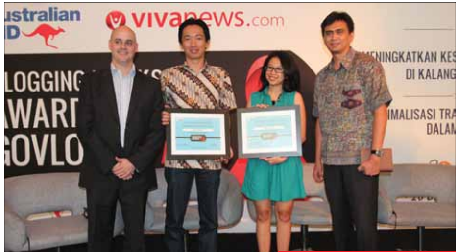
Pembicara dari Google dan praktisi adsense.

Menurut Enda, informasi tentang HIV/AIDS memang tidak dibutuhkan masyarakat setiap hari. “Tetapi, kalau (masyarakat) membutuhkan,