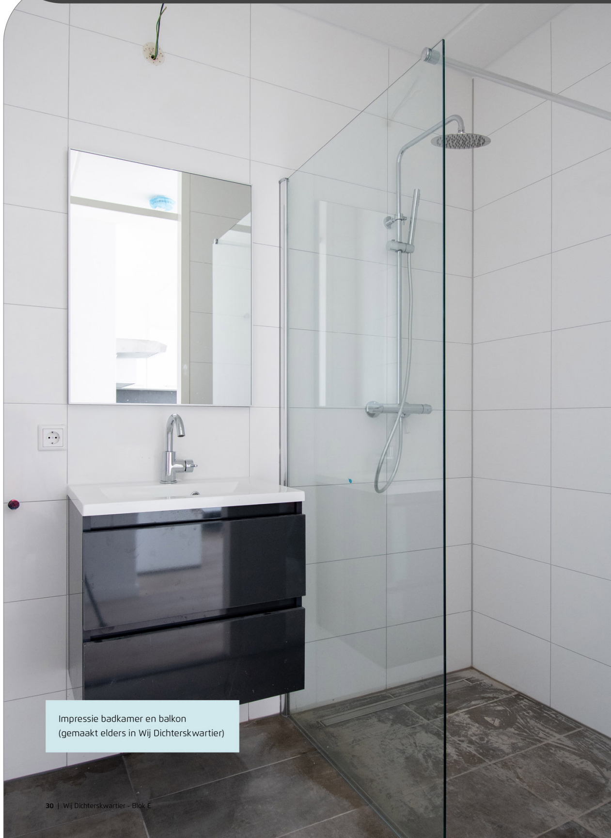
Impressie badkamer en balkon (gemaakt elders in Wij Dichterskwartier)