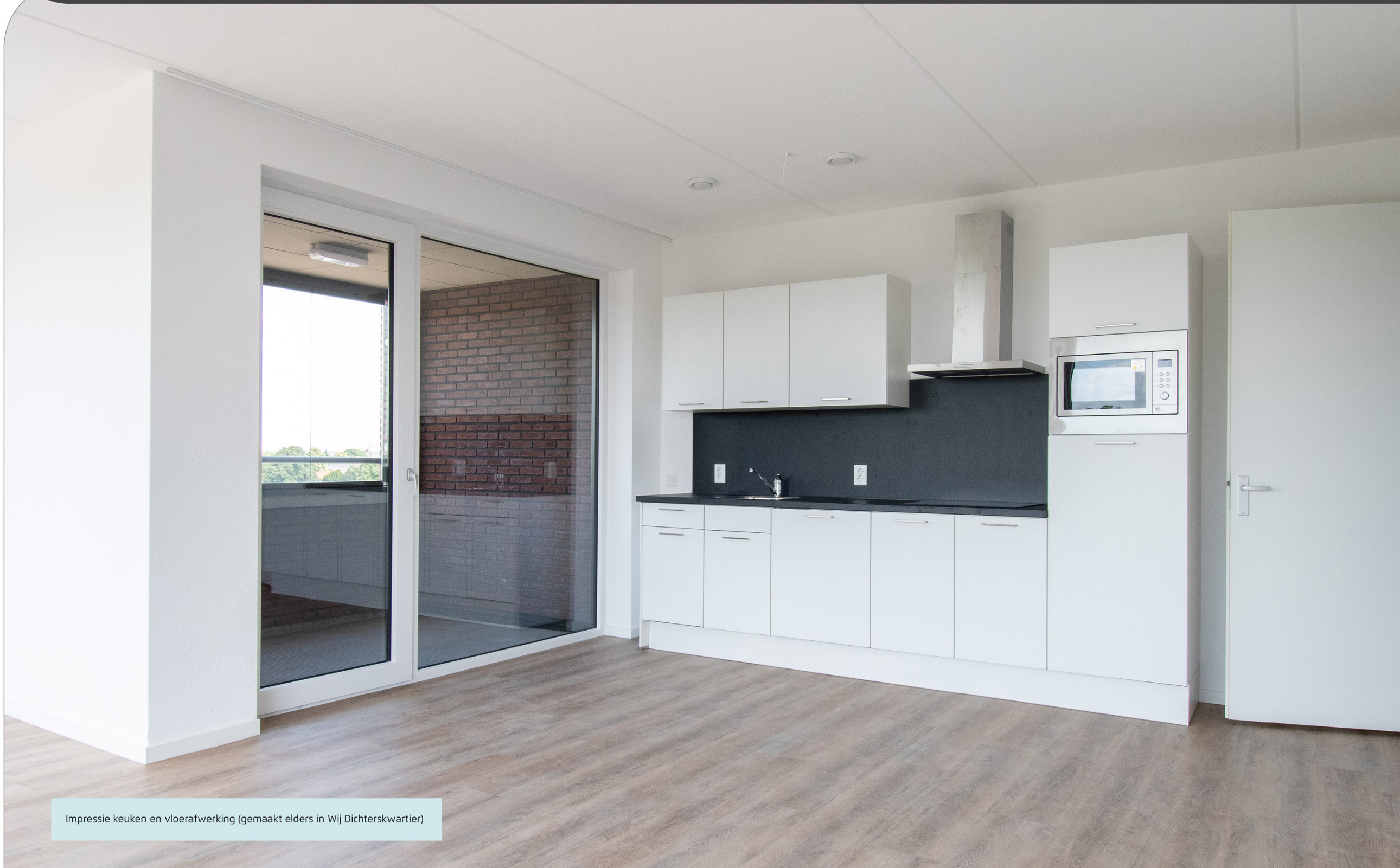
Impressie keuken en vloerafwerking (gemaakt elders in Wij Dichterskwartier)