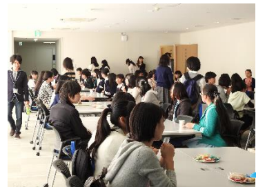
先輩大学院生と語るティータイム