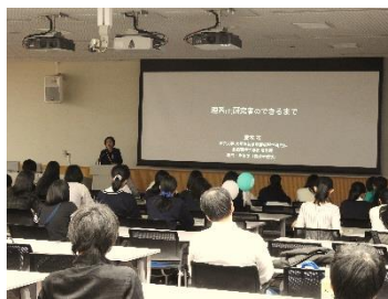
理系で活躍する先輩の講演