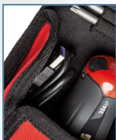
Tasca interna per il cavo USB-C