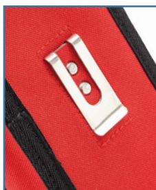
Gancio per cintura