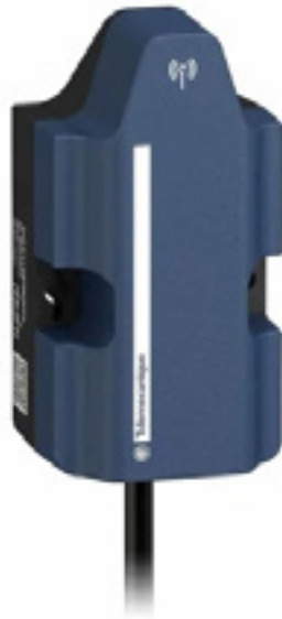
Bild 3. Der Telemecanique Transceiver basiert auf LPWAN-Technologie mit geringer Leistungsaufnahme und wird über das Sigfox-Kommunikationsnetzwerk betrieben.

LoRa ist ein offener Funkstandard und verwendet in seinen Sendern und Empfängern ausschließlich Semtech-Chips, weshalb der Betrieb eines LoRa-basierten Netzwerks (LoRaWAN) von nur einem Hersteller abhängig ist. Die zur Datenübertragung genutzten Frequenzen unterscheiden sich je nach Region. In Europa werden die Frequenzen von 433,05 – 434,79 MHz und 863 – 870 MHz genutzt. Australien und Nordamerika nutzen die Frequenz 915 MHz, während Indien auf 865 – 867 MHz und Asien via 923 MHz sendet. Die Reichweite kann bis zu 13 km (ländliche Gebiete) betragen. Der Energieverbrauch eines LoRa-Chips liegt bei 10 mA und 100 nA im Ruhemodus. Je nach Anwendungsfall beträgt die Batterielebensdauer zwischen 2 und 15 Jahre.