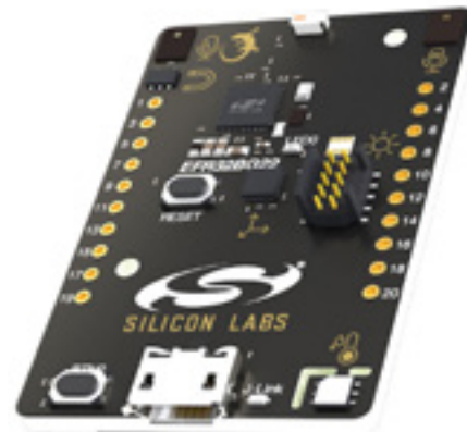
Bild 7. Das EFR32BG22-Modul wird in der Silicon Labs Bluetooth Direction Finding Lösung eingesetzt.

Als besonders brauchbar für den Industrieinsatz erweisen sich einige der quasi "eingebauten" Funktionen der Bluetooth-Technologie: