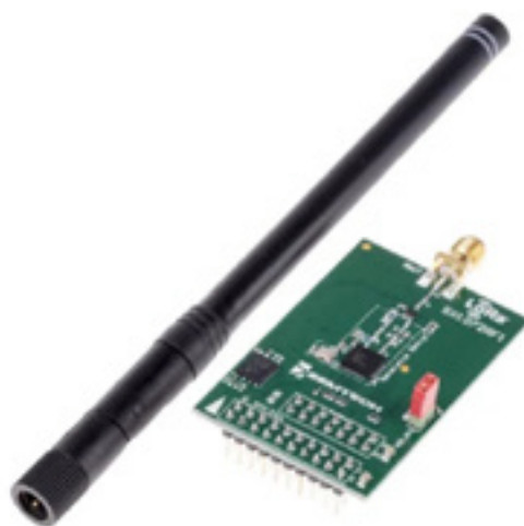
Bild 4. 868-MHz-ISM-Band-Transceiver-Evaluierungsmodul von Semtech mit LoRa-Technologie.

LoRa ist ein offener Funkstandard und verwendet in seinen Sendern und Empfängern ausschließlich Semtech-Chips, weshalb der Betrieb eines LoRa-basierten Netzwerks (LoRaWAN) von nur einem Hersteller abhängig ist. Die zur Datenübertragung genutzten Frequenzen unterscheiden sich je nach Region. In Europa werden die Frequenzen von 433,05 – 434,79 MHz und 863 – 870 MHz genutzt. Australien und Nordamerika nutzen die Frequenz 915 MHz, während Indien auf 865 – 867 MHz und Asien via 923 MHz sendet. Die Reichweite kann bis zu 13 km (ländliche Gebiete) betragen. Der Energieverbrauch eines LoRa-Chips liegt bei 10 mA und 100 nA im Ruhemodus. Je nach Anwendungsfall beträgt die Batterielebensdauer zwischen 2 und 15 Jahre.