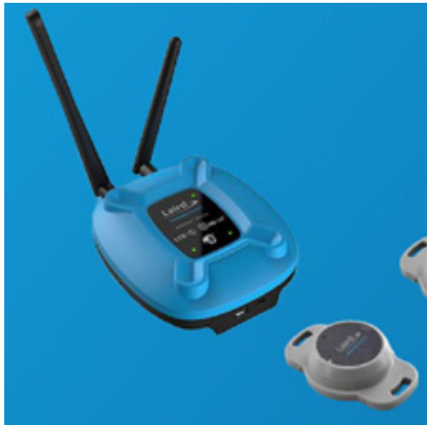
Bild 5. Sentrius MG100 von Laird Connectivity

NB-IoT- NarrowBand-IoT ist eine besondere LTE-Spezifikation (LTE-Cat-NB1) und wird von den LTE-Netzbetreibern für IoT-Anwendungen angeboten. Die Spezifikationen von NB-IoT verbessern die Reichweiten und Signalpegel des Mobilfunknetzes. Gleichzeitig reduziert sich die Komplexität des Funkmoduls, was unter anderem auch bedeutet, dass die maximalen Übertragungsraten in Sende- und Empfangsrichtung begrenzt sind (250 kBit/s), sich die Netzabdeckung aber um den Faktor zehn verbessert. Letzteres erlaubt eine verbesserte Gebäudedurchdringung.