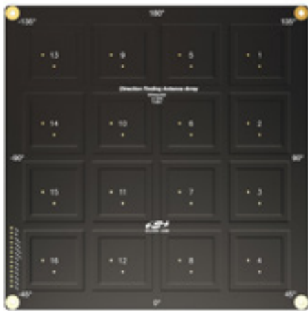
Bild 6. Das Silicon Labs Direction Finding Antenna Array, das in der Bluetooth Direction Finding Lösung von SiLabs verwendet wird.

Bluetooth ist eine Short-Range-Technologie und arbeitet im ISM-Band (Industrial, Scientific and Medical Band) zwischen 2,402 GHz und 2,480 GHz und kann ohne weitere Zertifizierung in jedem Land der Erde eingesetzt werden. Das Funksystem verwendet das Frequency-Hopping-Verfahren, das für jedes Datenpaket einen der bis zu 79 Funkkanäle wählt, sodass sich Störungen nur minimal auswirken. Praktisch eignet sich Bluetooth in industriellen Applikationen zur Überbrückung von Reichweiten bis etwa 200m.