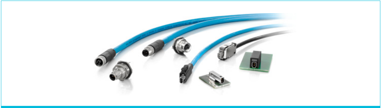
Bild1. Steckverbinder nach IEC 63171-2 und Typen nach IEC 63171-5.