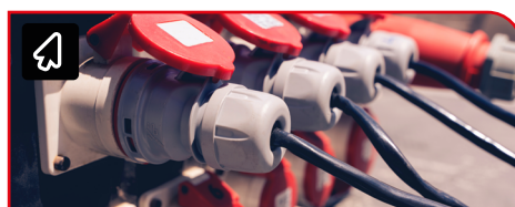
主電源・DC電源コネクタ