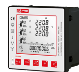
多機能パネルメータ