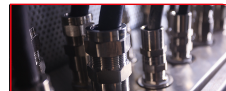
ケーブルグランド / 固定具