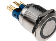
プッシュボタンスイッチ・ コンポーネント