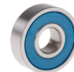
ベアリング・軸受ユニット