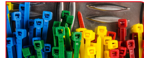
ケーブルタイ / 固定具