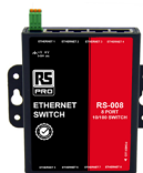
ネットワークハブ