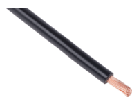
フックアップ配線