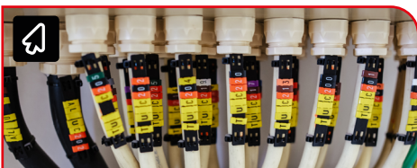
ケーブルマーカー