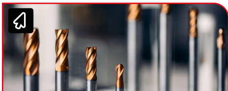
ドリルビット / パーツ