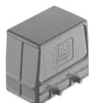
ヘビーデューティ パワーコネクタ