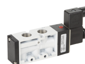
空圧コネクタ / 継手 / ホース