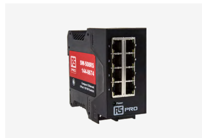
ETHERNETOVÝ PŘEPÍNAČ RJ45