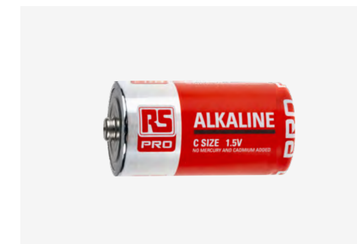
ALKALICKÁ BATERIE 1.5V