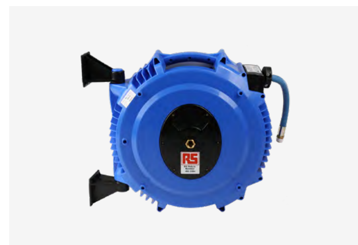
SAMONAVÍJACÍ HADICOVÝ BUBON