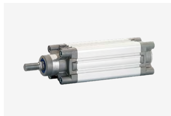
PNEUMATICKÝ VALEC VODIACÍCH TYČÍ