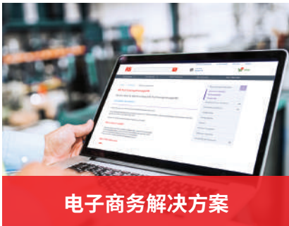
电子商务解决方案