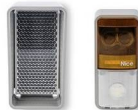
FOTOCÉLULA REFLEXIVA EPMOR