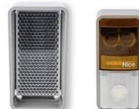
FOTOCÉLULA REFLEXIVA EPMOR