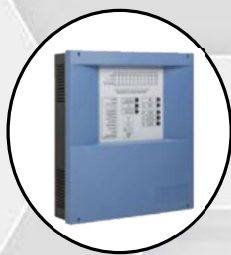
Centrales de incendio