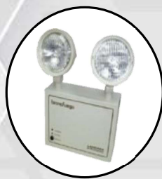
Lámparas de emergencia