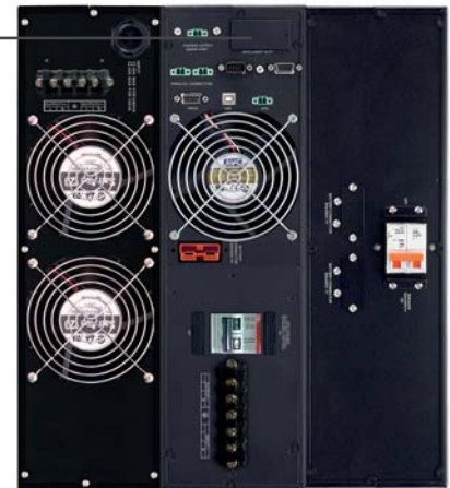
Módulo de control