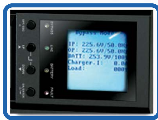
Display LCD Muestra voltajes de entrada, salida, tiempos de autonomía y carga de batería.