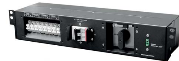
Conmutador de Bypass de mantenimiento