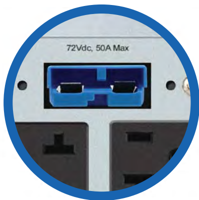
Conector para banco de baterías externo