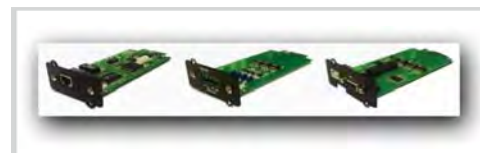
Tarjetas opcionales SNMP y de control