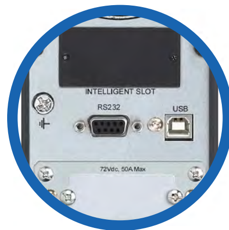
Puertos de comunicación