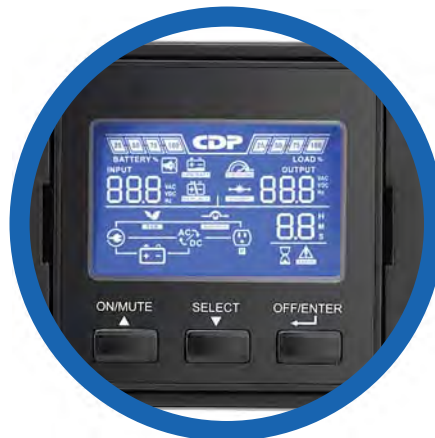
Panel LCD con rotación de 90°