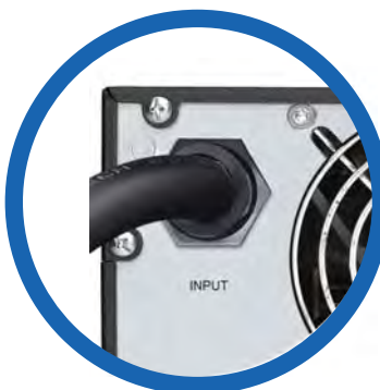
Cable de alimentación CA