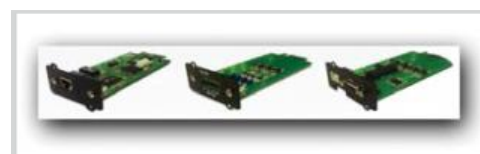
Tarjetas opcionales SNMP y de control