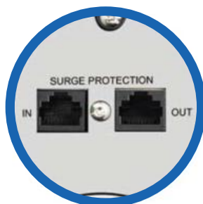
Protección de línea de datos