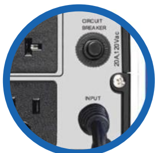
Cable de alimentación CA