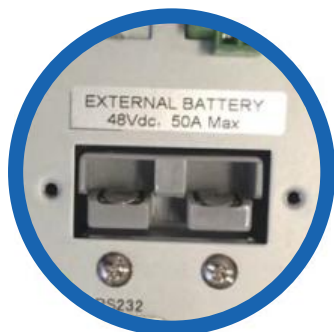
Entrada banco de baterías externas

8 terminales NEMA 5-15R, de los cuales 4 son programables