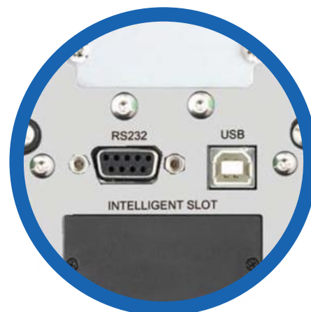
Puertos de comunicación