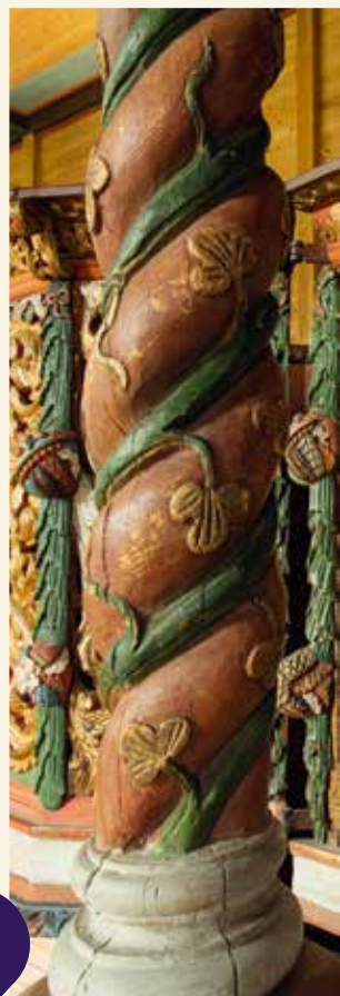
DETALJ ÅL KYRKJE, FOTO OLE J. BRYE.