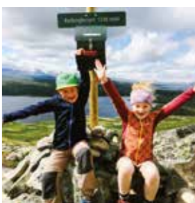
Vinner/Winner 2016:

Photo competition on Instagram: Take a picture when you are at this year's 10 favorite hikes in Ål and #Ål52. Winner picture will be selected in October. You need an open profile on Instagram, and you need to follow alturistinfo.