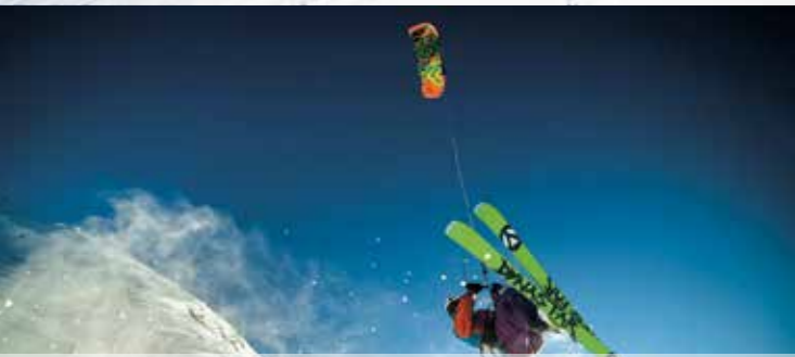
NORGES BESTE OMRÅDER FOR KITING