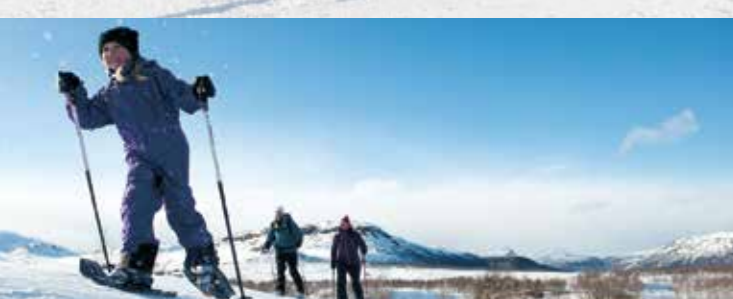
TRUGETUR I ÅPENT LANDSKAP