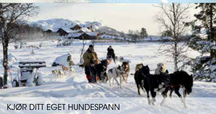
KJØR DITT EGET HUNDESPANN