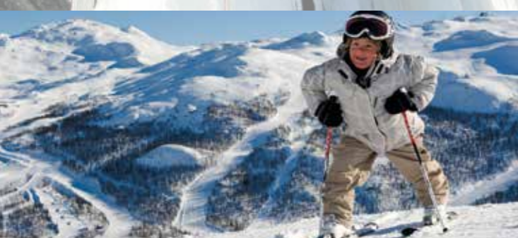
14 SKISENTER OG 200 NEDFARTER