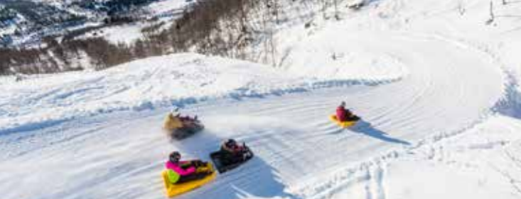
TO AV NORGES LENGSTE AKEBAKKER