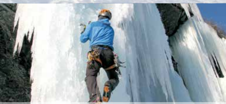
KLATRING I FROSNE FOSSEFALL