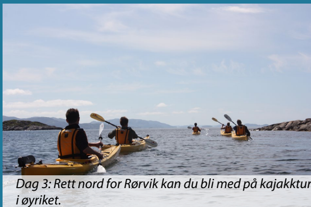
Dag 3: Rett nord for Rørvik kan du bli med på kajakkstur i øyriket.