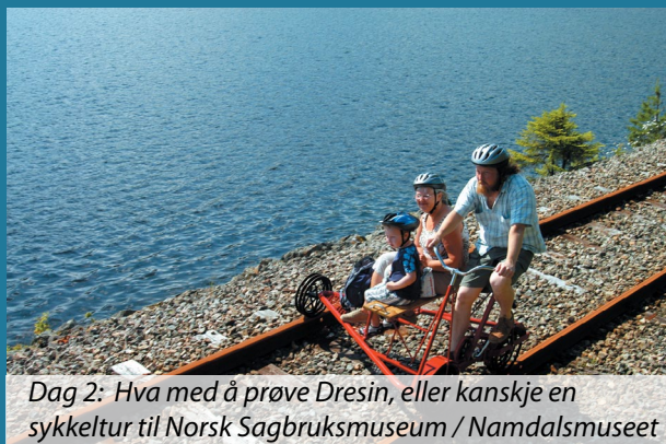
Dag 2: Hva med å prøve Dresin, eller kanskje en sykkeltur til Norsk Sagbruksmuseum / Namdalsmuseet