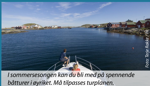
I sommersesongen kan du bli med på spennende båtturer i øyriket. Må tilpasses turplanen.