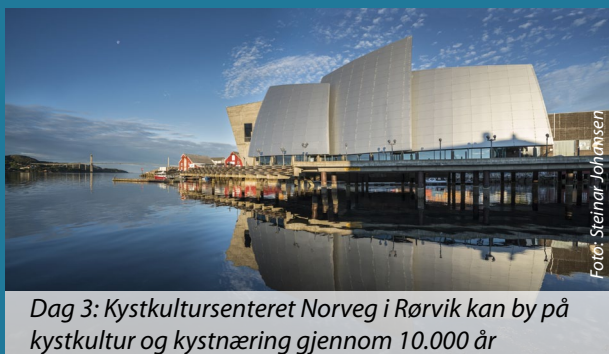
Dag 3: Kystkultursenteret Norge i Rørvik kan by på kystkultur og kystnæring gjennom 10.000 år