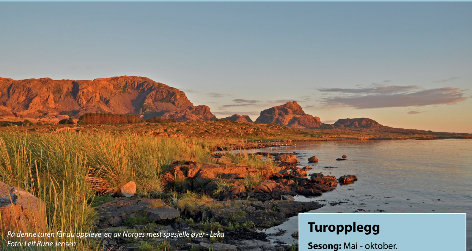
På denne turen får du oppleve en av Norges mest spesielle øyer - Leka

Opplev Norges mest spennende og spektakulære øy Leka, vakre Abelvær, og det fredede fiskeværret Sør - Gjæslingan. I dette turforslaget, som kan gjøres på 4 - 6 dager, hopper du fra høydepunkt til høydepunkt langs Namdalskysten.