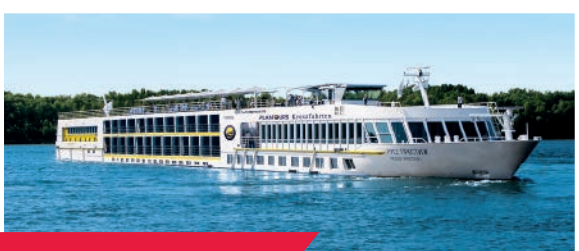
MS ROUSSE PRESTIGE