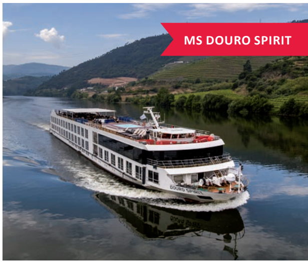
MS DOURO SPIRIT