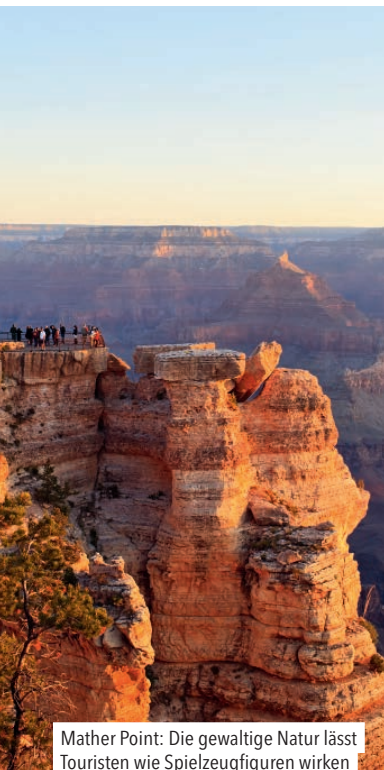
Mather Point: Die gewaltige Natur lässt Touristen wie Spielzeugfiguren wirken

Osten zielt. Nächster Stopp: 5 Williams , ein Touristenstädtchen an der alten Route 66 mit Westernflair, vielen Lokalen und witzigen Souvenirläden entlang der Railroad Avenue. Gut zum Lunch mit schönem Roadmoviecharme: die Terrasse des Cruiser's Cafe 66 ( cruisers66.com ).