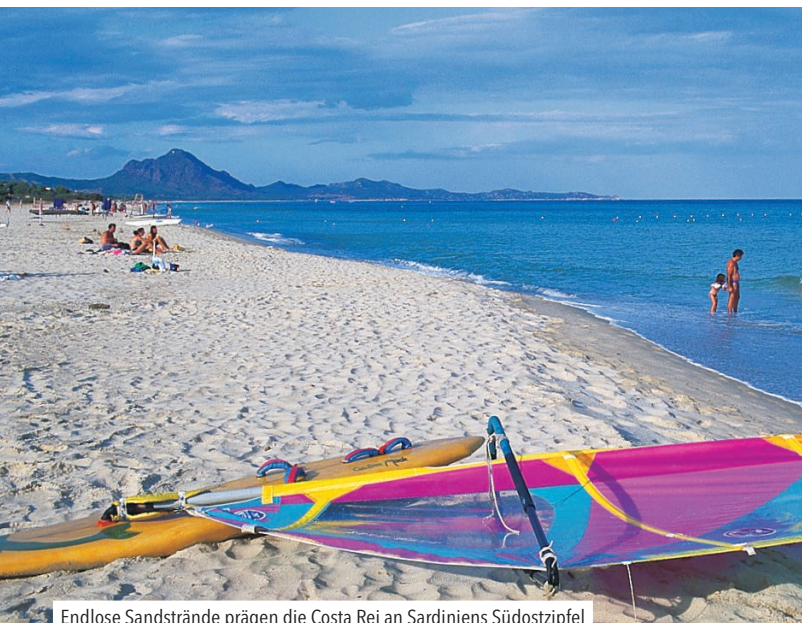
Endlose Sandstrände prägen die Costa Rei an Sardinien's Südostzipfel