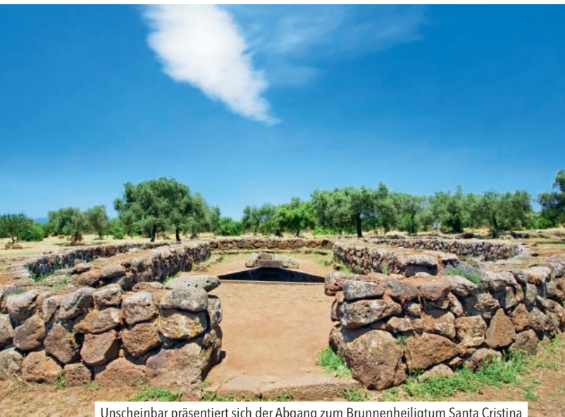
Unscheinbar präsentiert sich der Abgang zum Brunnenheiligtum Santa Cristina