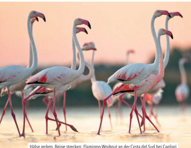
Hälsa recken, Beine strecken: Flamingo-Workout an der Costa del Sud bei Cagliari

die Gäste der Luxusherberge die gesamte Küste. Noch Zeit? Dann folg dem holprigen alten Küstenweg noch eine halbe Stunde bis zur Spaggia di Ferraglione – in der einsamen, kieseligen Bucht kannst du im Wortsinn abtauchen: Die Unterwasserwelt, die du hier