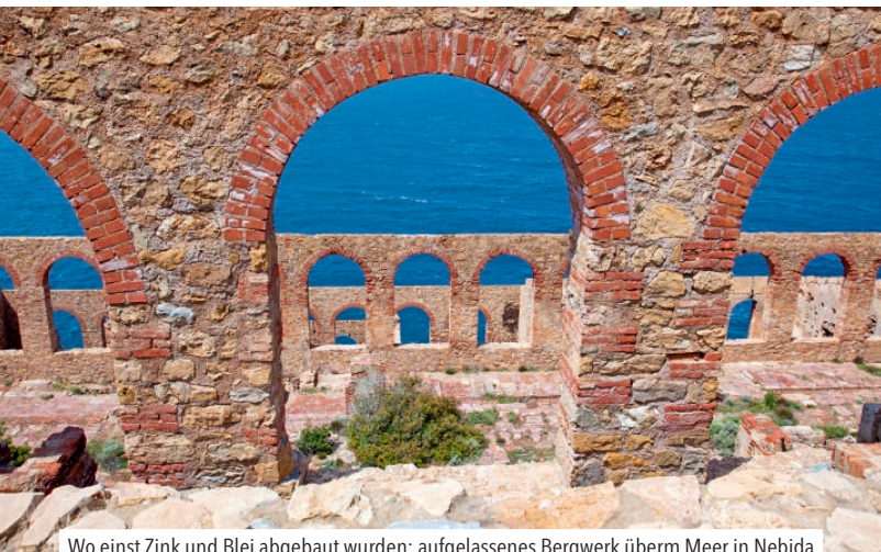
Wo einst Zink und Blei abgebaut wurden: aufgelassenes Bergwerk überm Meer in Nebida

nen und wenn du so richtig ausgepowert bist, ab ins Wasser!