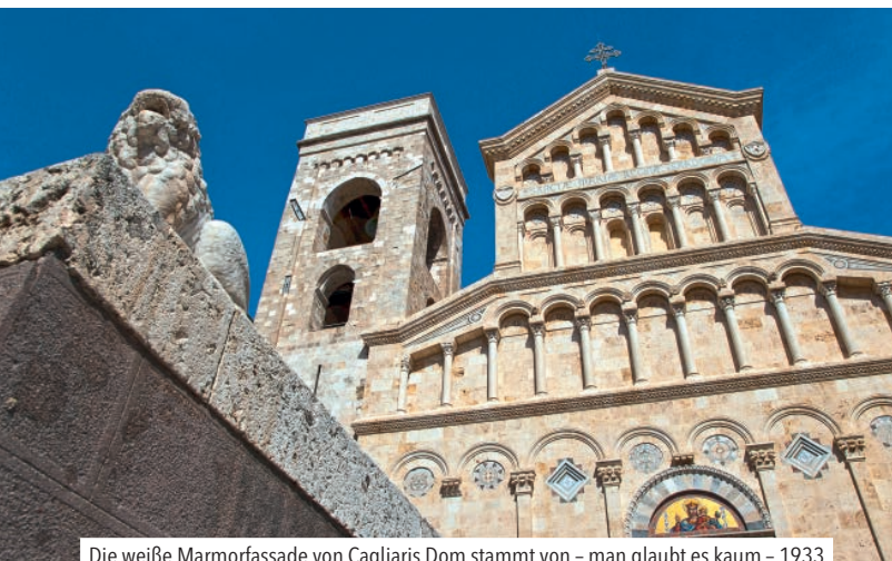
Die weiße Marmorfassade von Cagliari's Dom stammt von – man glaubt es kaum – 1933

sind heute schicke Altbauflats, dazwischen bewohnen noch die alten Stadtbewohner die einstigen Prachtbauten mit ihren engen Höfen.