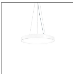
Luminaire rond ONDA2 P AV D590 LED3000-840 LDE WH 42185441

La présente déclaration de produit environnemental (EPD) est basée selon les normes EN ISO 14025 et EN 15804 et décrit les impacts spécifiques environnementaux du produit mentionné. Cette déclaration fait suite également aux exigences spécifiques et concrètes du programme Institut Bauen und Umwelt e.V. (IBU) selon les règles de calcul des LCA et le contenu de l'EPD (de base) selon les instructions de PCR sous-jacentes (PCR: Règles de catégorie de produit) pour «Luminaires, lampes et composants pour luminaires» (Ref: IBU PCR Teil A et B). Le produit décrit sert d'unité déclarée. La déclaration inclut une description du produit, des informations sur la composition des matériaux, la production, le transport, la phase d'utilisation, l'élimination et le recyclage, ainsi que les résultats de l'évaluation du cycle de vie. Les EPD des produits de construction sont comparables uniquement si les valeurs sont calculées conformément au même PCR et des scénarios d'utilisation appropriés et obligatoires.