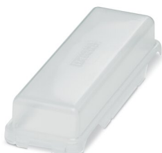
Capot de protection, type: B24

Veillez tenir compte du fait que les données affichées dans ce document PDF proviennent de notre catalogue en ligne. Vous trouverez les données complètes dans la documentation utilisateur. Nos conditions générales d'utilisation des téléchargements sont applicables.