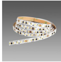
Strip - LED 24V - CRI>90