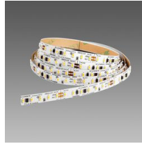
Strip - LED 24V - CRI>90