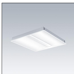
Optique à efficacité plate (MPT) IQ BEAM 4300-840 MPT HF Q600 96634276