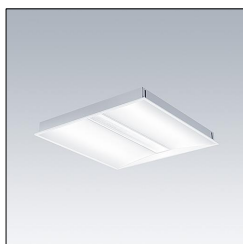
Optique à efficacité plate (MPT) IQ BEAM 4300-840 MPT HF Q600 96634276

La présente déclaration de produit environnemental (EPD) est basée selon les normes EN ISO 14025 et EN 15804 et décrit les impacts spécifiques environnementaux du produit mentionné. Cette déclaration fait suite également aux exigences spécifiques et concrètes du programme Institut Bauen und Umwelt e.V. (IBU) selon les règles de calcul des LCA et le contenu de l'EPD (de base) selon les instructions de PCR sous-jacentes (PCR: Règles de catégorie de produit) pour «Luminaires, lampes et composants pour luminaires» (Ref: IBU PCR Teil A et B). Le produit décrit sert d'unité déclarée. La déclaration inclut une description du produit, des informations sur la composition des matériaux, la production, le transport, la phase d'utilisation, l'élimination et le recyclage, ainsi que les résultats de l'évaluation du cycle de vie. Les EPD des produits de construction sont comparables uniquement si les valeurs sont calculées conformément au même PCR et des scénarios d'utilisation appropriés et obligatoires.