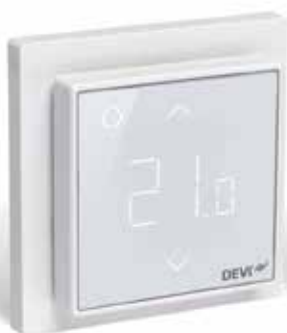
DEVIreg Smart Blanc polaire (RAL 9016) réf. 140F1140