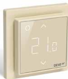
DEVIreg Smart Ivoire (RAL 1013) réf. 140F1142