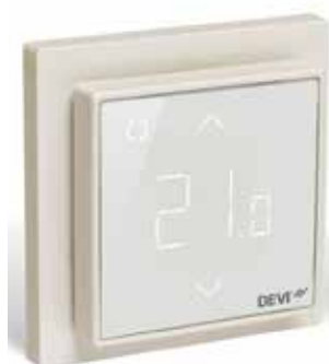
DEVIreg Smart Blanc pur (RAL 9010) réf. 140F1141