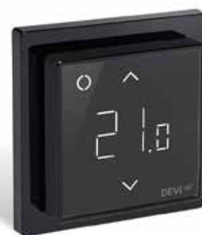
DEVIreg Smart Noir pur (RAL 9005) réf. 140F1143