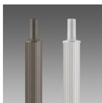
1408 Mât strié Ø100 avec base