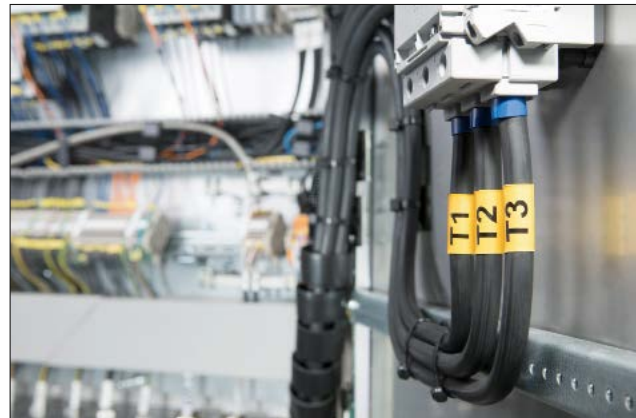
TULT DS - Repères thermorétractables avec une bonne résistance mécanique pour une large gamme d'applications