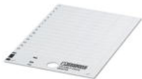
La figure montre la variante US-EMLP (20x9)

Etiquette en plastique, Carte, blanc, vierge, repérable avec : THERMOMARK PRIME, THERMOMARK CARD, Type de montage: Collage, Surface utile: 27 x 8 mm